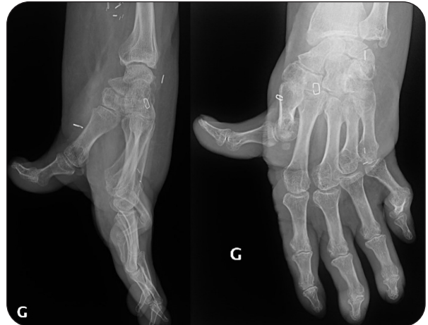
Figure 4. Radiographies post-opératoires après le retrait des broches d'arthrorise permettant de voir l'importante correction de la déformation qui a été nécessaire

de réaliser une couverture de type «all around flap» qui a été facilitée par la bonne corpulence du patient (Figure 3). Enfin, nous réalisons une fermeture directe du site donneur.