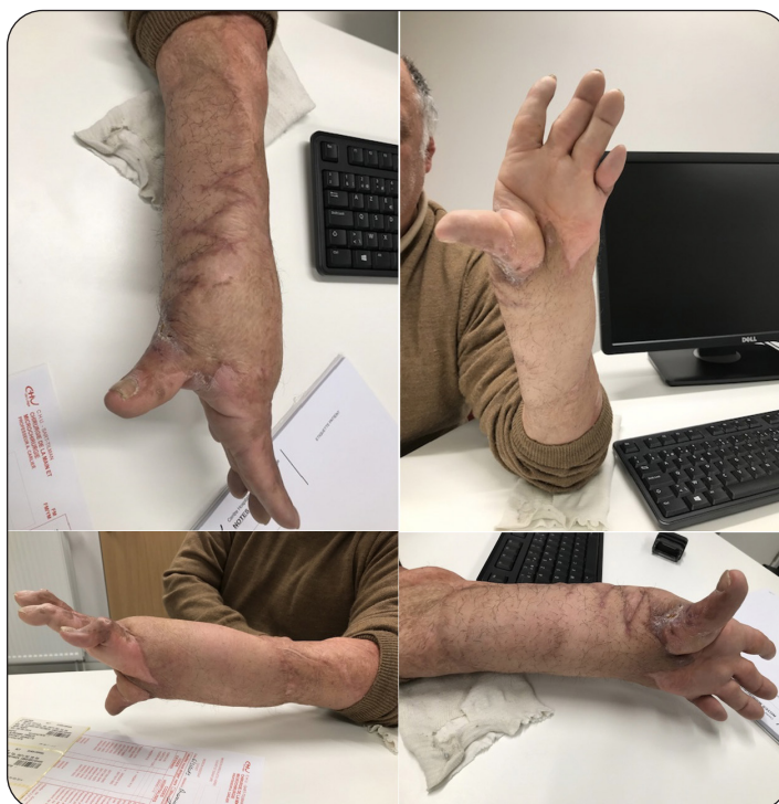
Figure 5. Résultat clinique à 2 ans de la chirurgie initiale