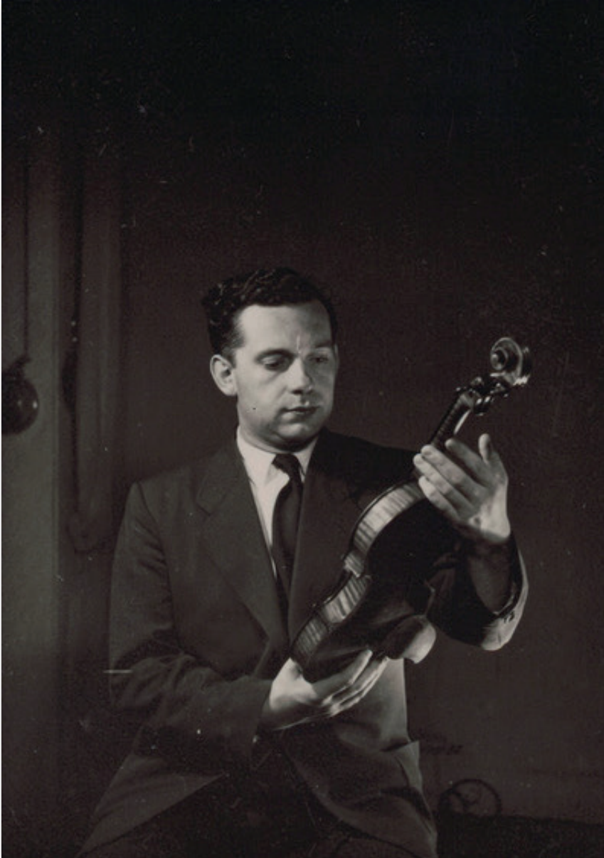
Fig. 1 : Arthur Grumiaux au début des années 1950 11 .