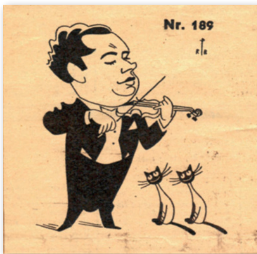
Fig. 4 : caricature d'Arthur Grumiaux par l'illustrateur allemand Rolf Peter Bauer (1912–1960) tirée d'une coupure de presse allemande 95 .