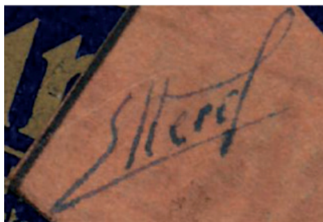
Fig. 2 : Signature non identifiée sur un 78 tours 87 .

Le décès prématuré d'Arthur Grumiaux en 1986 survient quelques années à peine après la commercialisation du Compact Disc (CD) par les firmes Sony et Philips. Aucun enregistrement inédit du violoniste ne sera donc édité sur ce nouveau support. Pourtant, les disques posthumes d'Arthur Grumiaux sont très nombreux. La firme Philips, avec laquelle Grumiaux a enregistré entre 1953 et 1978, a numérisé la totalité des enregistrements parus sur vinyles et les a transférés sur disques compacts. Une grande partie de ceux-ci figure dans le fonds. Les CD d'autres interprètes sont pour la plupart des enregistrements de musique romantique, moderne ou contemporaine réalisés par la Société Philharmonique de Bruxelles, dont certains avec le soutien de la Fondation Arthur Grumiaux.