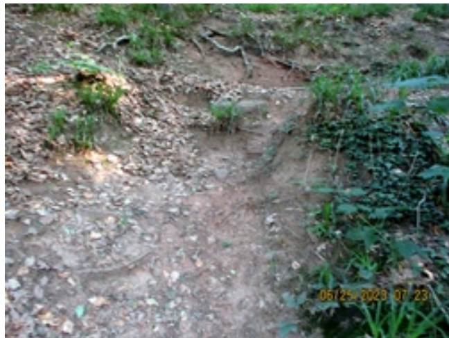
Dégradation d'un talus le long du sentier menant à la Roche tournante.

Plusieurs talus s'affaissent le long du sentier de Grande Randonnée (voir photo ci-après).