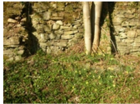
Murs en pierres sèches du Livremont.

Ci-dessus : station de Jonquilles au pied d'un de ces murs.