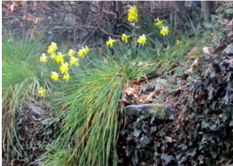
Jonquilles Narcissus pseudonarcissus sur un mur en pierres sèches du Livremont

La galanthamine n'est toutefois pas le seul alcaloïde isolé à partir du genre Narcissus . Il y en a plus de 300 autres et la plupart présentent une certaine forme d'activité biologique. La lycorine, par exemple, a des effets antibactériens, antiviraux et anti-inflammatoires. Elle présente aussi diverses propriétés inhibitrices sur de nombreuses lignées cellulaires cancéreuses (ibidem).