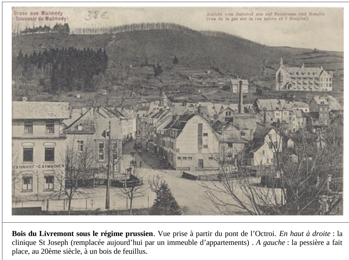
Bois du Livremont sous le régime prussien. Vue prise à partir du pont de l'Octroi. En haut à droite : la clinique St Joseph (remplacée aujourd'hui par un immeuble d'appartements) . A gauche : la pessièra a fait place, au 20ème siècle, à un bois de feuillus.

Sous le régime prussien (photo ci-après), une partie des feuillus avaient été abattus et de nombreux jardins équipés de murs en pierres sèches avaient été aménagés au pied du bois du Livremont. Sur la Roche tournante , un kiosque a été installé au début du XXème siècle par la Société d'embellissement (« Verschönerungsverein »).