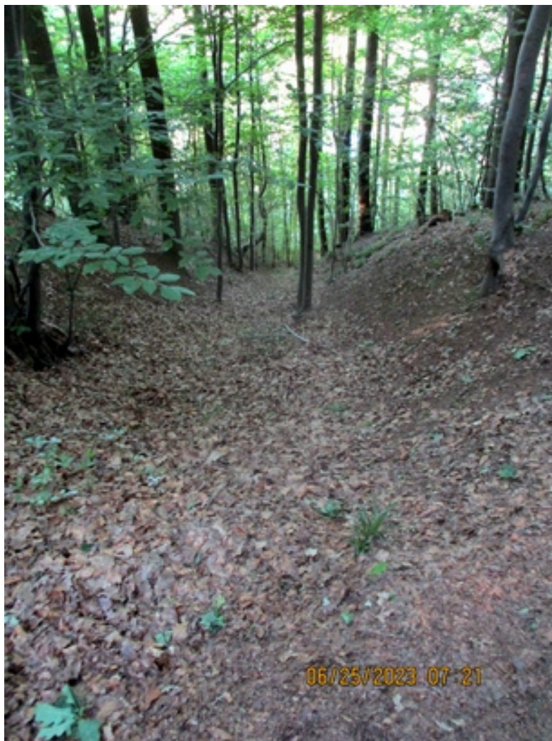
Un exemple de ravinement dans une parcelle communale, près de la Roche tournante .

Les fortes pluies devraient accroître le ravinement de certaines parcelles communales (voir photo ci-dessous).