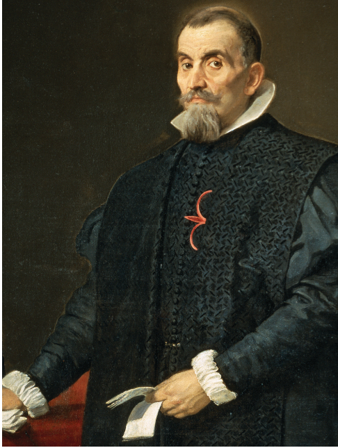
Diego de Velázquez, Retrato de Diego del Corral y Arellano, 1632, Museo nacional del Prado