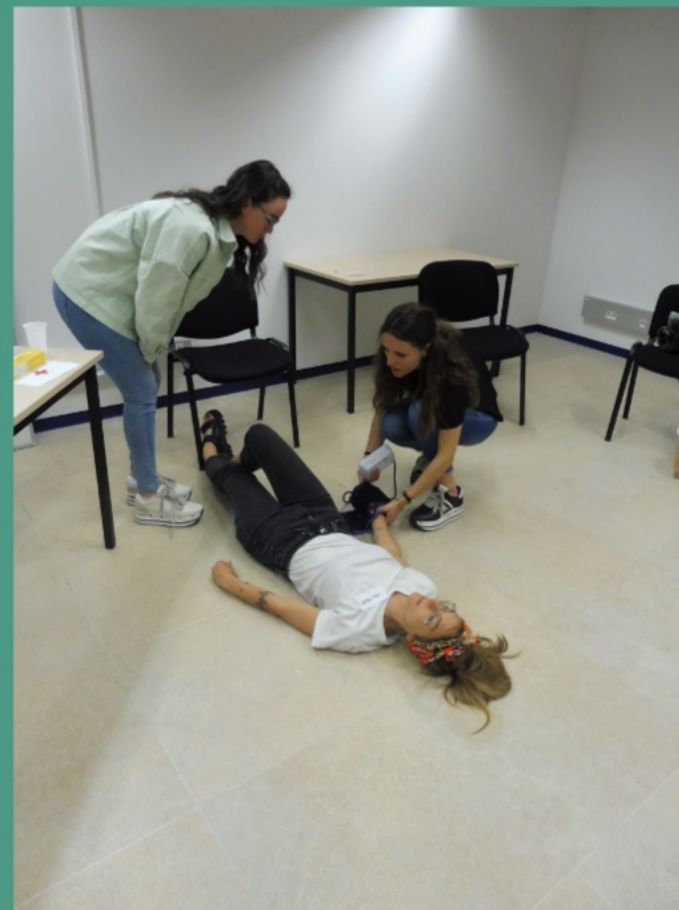
Jeu de rôle