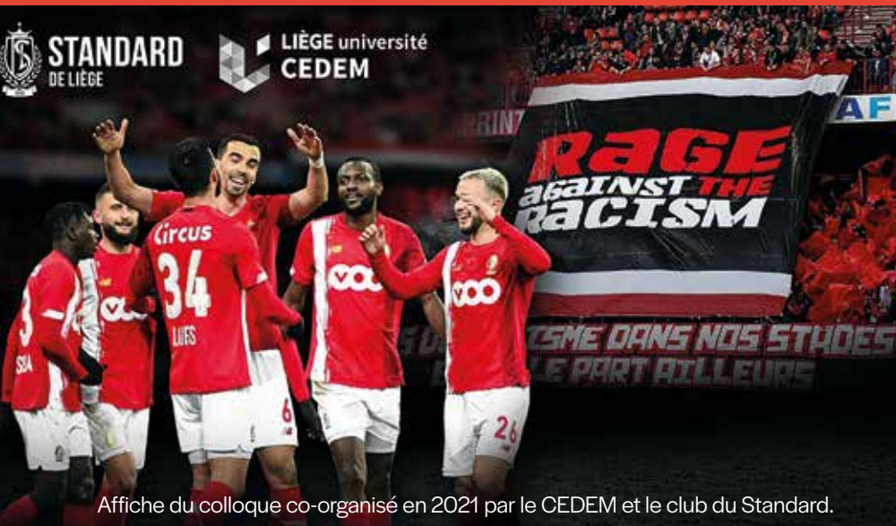
Affiche du colloque co-organisé en 2021 par le CEDEM et le club du Standard.

indo pakistanaise. La raison invoquée jusqu'il y a peu : ce n'est pas un sport pour eux ! Par ailleurs, un scandale a visé l'entraîneur de l'équipe nationale de football français suspecté de favoriser un même type de profil pour jouer en défense, avec des hommes noirs d'1m90 musclés. Même dans l'athlétisme, on dirige les enfants noirs vers le sprint et non vers les disciplines techniques, en se basant sur un double préjugé : d'abord considérer que le sprint n'est pas une discipline technique ; ensuite, croire que les Noirs courent plus vite parce qu'ils auraient une musculature différente. Pas nécessairement explicités dans le monde du sport, ces préjugés sont bien présents et participent à reproduire les inégalités.