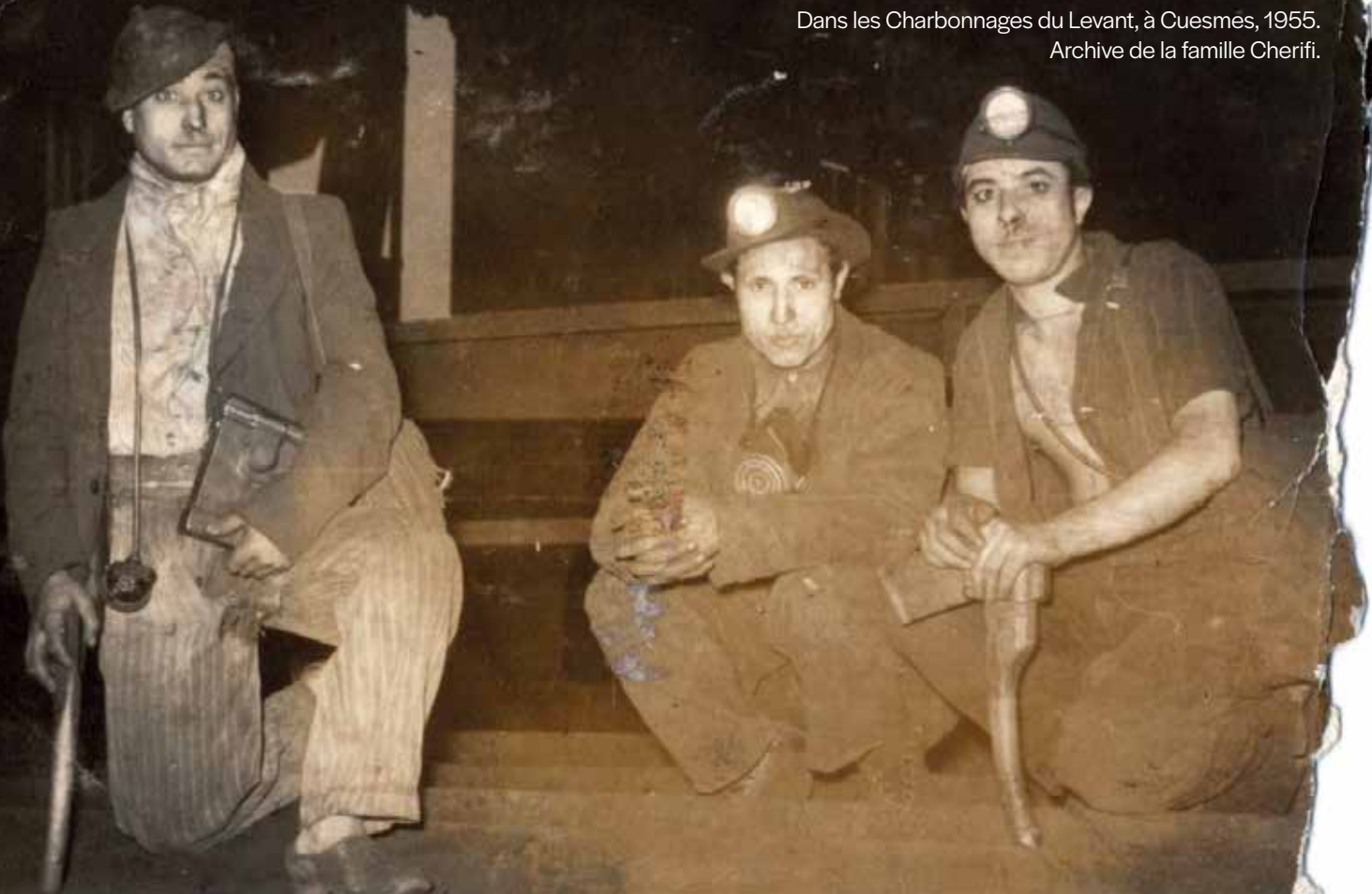
Dans les Charbonnages du Levant, à Cuesmes, 1955.

Selon ces temps forts successifs, ces Algériens et Algériennes ont connu une histoire, des luttes et des acquis différents, qui sont à ce jour insuffisamment étudiés. Modestement, nous avons cherché à décrire par petites touches quelques composantes de cette communauté plurielle, en cette année du 60 e anniversaire de l'indépendance de l'Algérie.