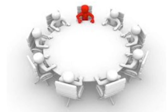
Échanges avec un professionnel de chaque discipline