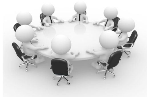
Présentation Compétences- Limites par discipline