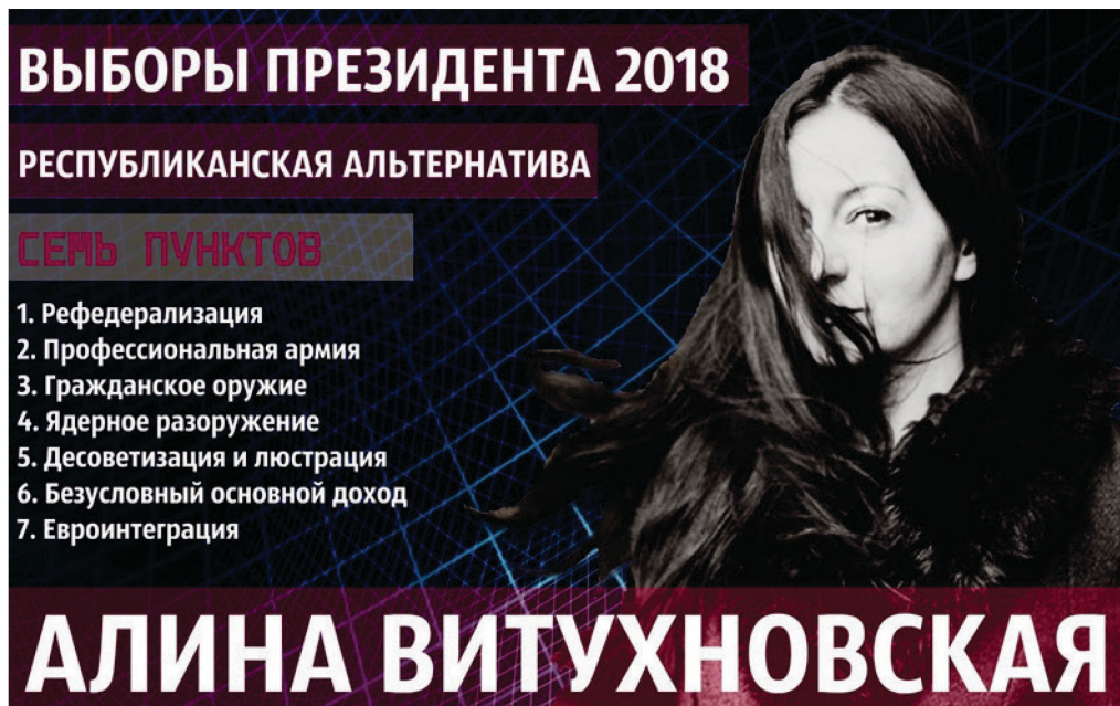
Abb. 5: Vituchnovskajas Werbeplakat “Russian politics” mit Wahl-Programm