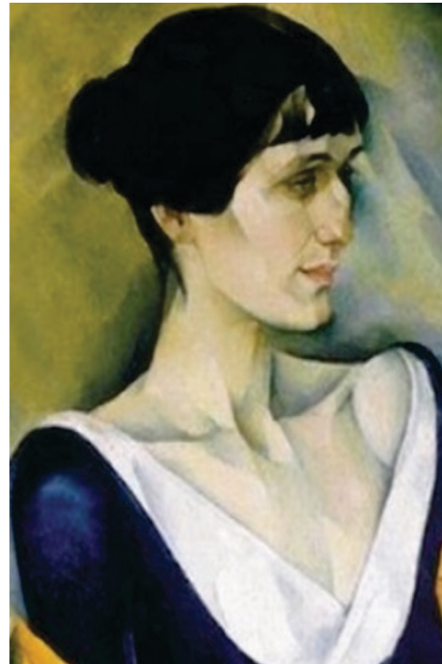
Abb. 4: Natan Al'tman: Anna Achmatova. 1914, Öl auf Leinwand, 123,5x13,2cm. Ausschnitt. Gosurdarstvennyj russkij muzej.