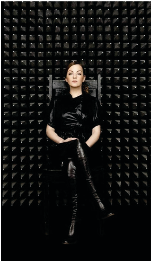
Abb. 1: „Die schwarze Ikone“

Medienperson: „Schwarze Ikone der russischen Literatur“ («Черная икона русской литературы»). 89 Damit ist ungeachtet der genannten sexuellen Konnotation staatliche Autorität und kirchliche Tradition in Anspruch genommen; auf christlichen Ikonen wurden die Dreifaltigkeit, Christi Jünger, Heilige und andere zu verehrende Personen wie die Gottesmutter abgebildet. Der von oben herab auf den Betrachter gerichtete feste Blick beansprucht Kontrolle und verkörpert Machtanspruch. 90