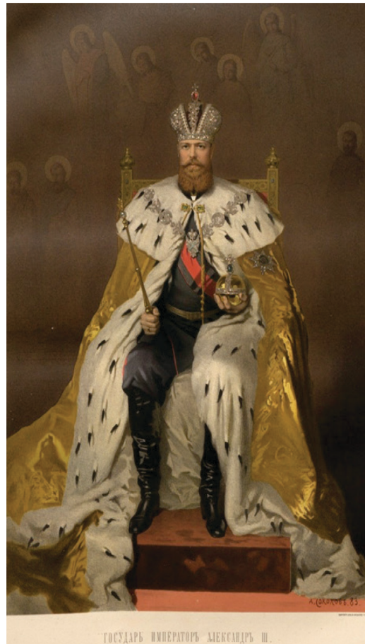
Abb. 2: Aleksandr Sokolov (1883) Aleksandr III. im Krönungsgewand, (1883). Farblithographie. Sankt-Peterburg, Kartografičeskoe zavedenie A.A. Il'ina, Gosudarstvennyj muzej-zapovednik, Carskoe selo.