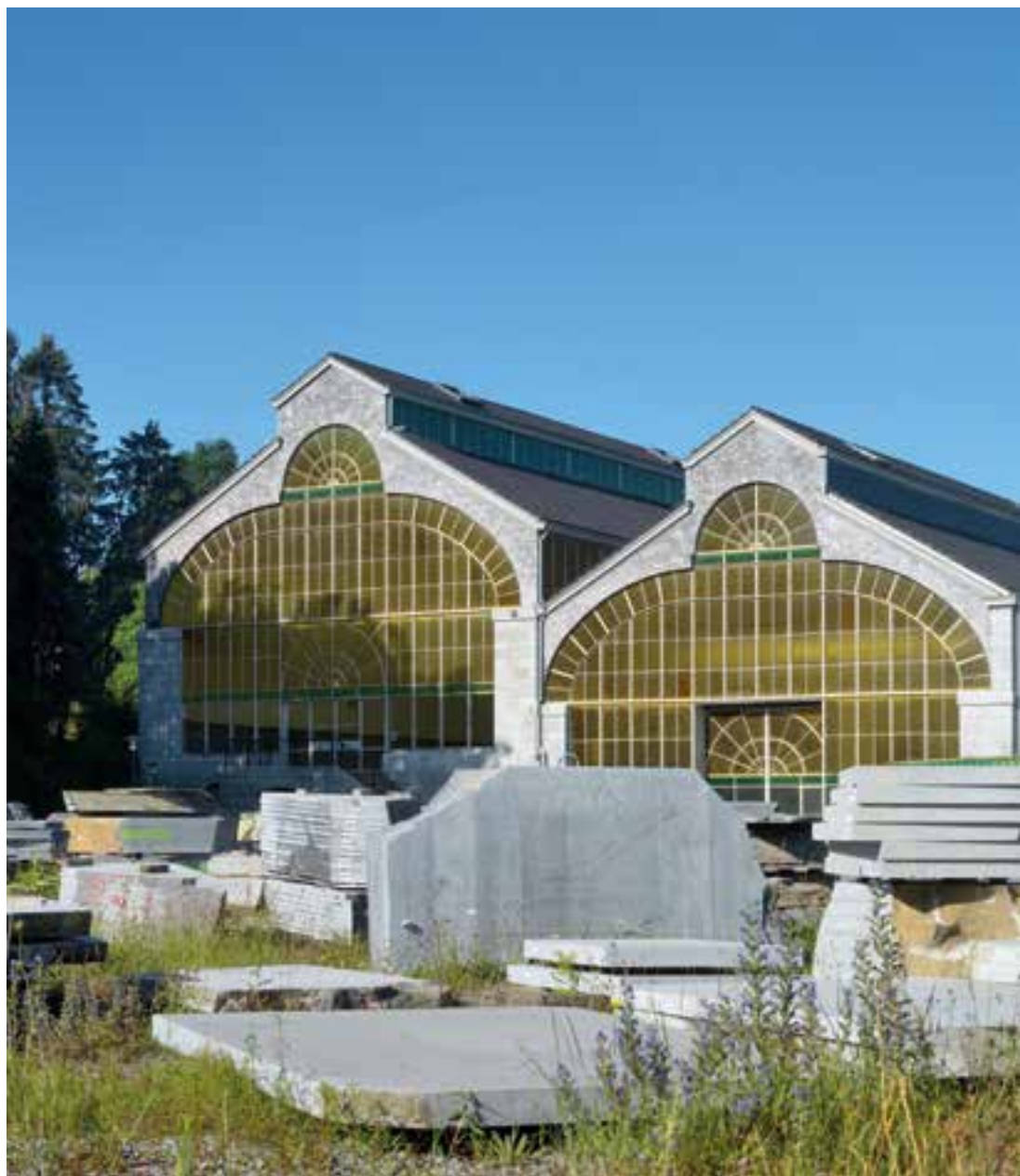
1. L'ancienne centrale électrique.