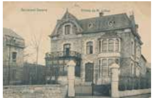
2. La maison du maître de carrière et bourgmestre Leduc.