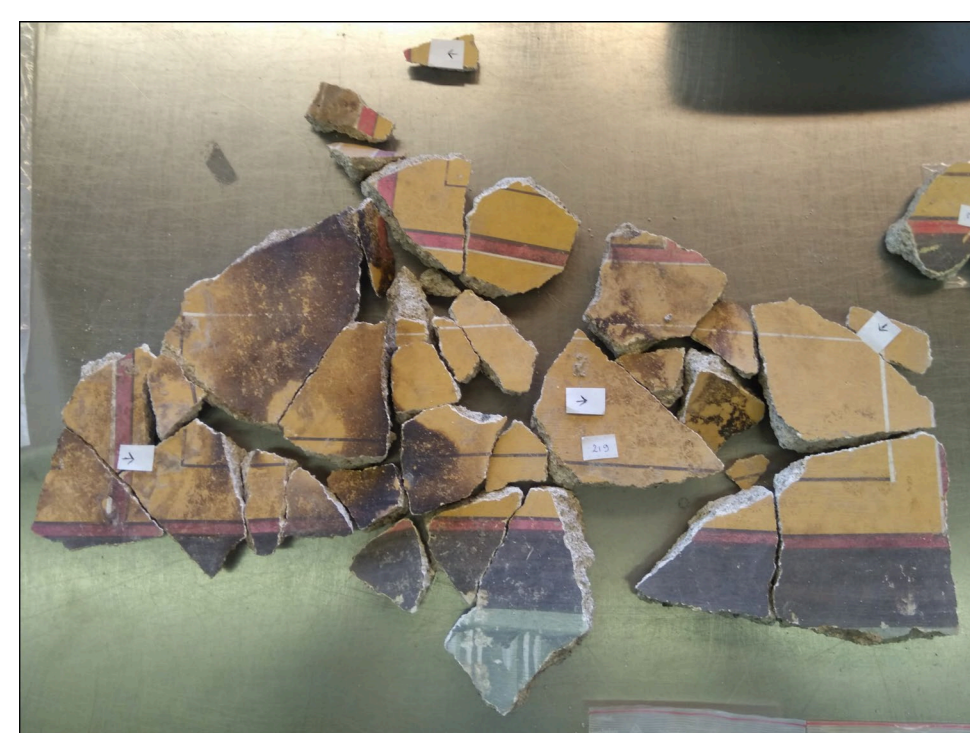
Fig.3: Il lavoro di rimontaggio.

Le informazioni raccolte vengono ad alimentare il lavoro di ricostituzione dello schema decorativo in corso. Tramite un software CAD, le fotografie degli insiemi sono inserite in un disegno al tratto (Fig.4). Quest'ultimo giustifica ulteriormente la ricostituzione colorata che è stata proposta (Fig.2f).