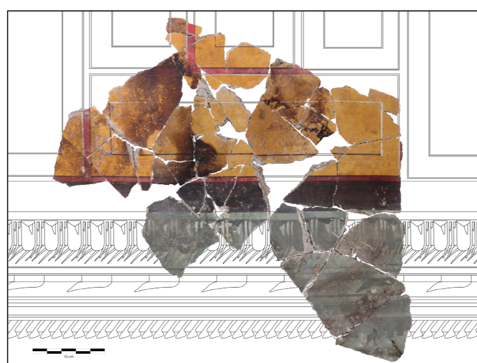
Fig.4: Disegno al tratto con fotografie delle insiemi (parziale). CAD da L. Motta.