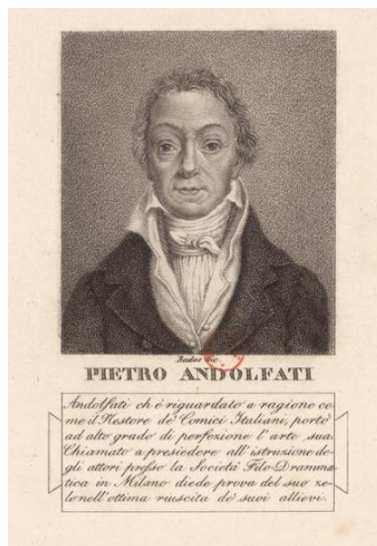
Figura 1 – L. Rados, Portraits de Pietro Andolfati , Bibliothèque nationale de France, département Estampes et photographie, N-2, ark:/12148/btv1b8530750f .

La compagnia di Antonio Raftopulo tentò poi un esperimento simile portando in scena a Milano, alla Canobbiana nel gennaio 1826 e al Re nella stagione 1828/29, il