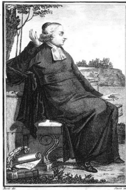
Carlo Michele abate Dell'Épée

E, come in Francia, anche in Italia la pièce di Bouilly, tanto in scena quanto in forma di libro, avrebbe concorso alla fama europea di l'Épée, protagonista di «un dramma benefico all'umanità» che lo celebrava quale «ente salutare» (così le «Notizie storico-critiche» in Bouilly, 1801 b : 80). Ancora nel 1833, il linguista e scrittore Niccolò Tommaseo (1802-1874) 13 , nel resoconto di una visita all'istituto per sordi di Siena, si riferiva alla pièce di Bouilly nel descrivere la modalità di comunicazione di un bambino sordo: