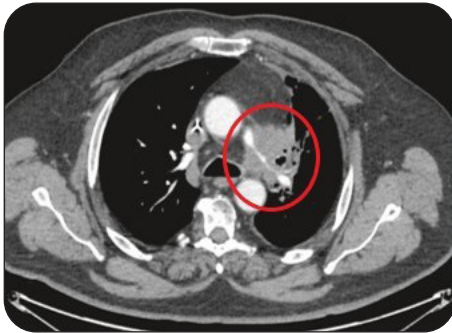
Figure 2. Sténose de l'artère pulmonaire gauche avant traitement (artériographie).