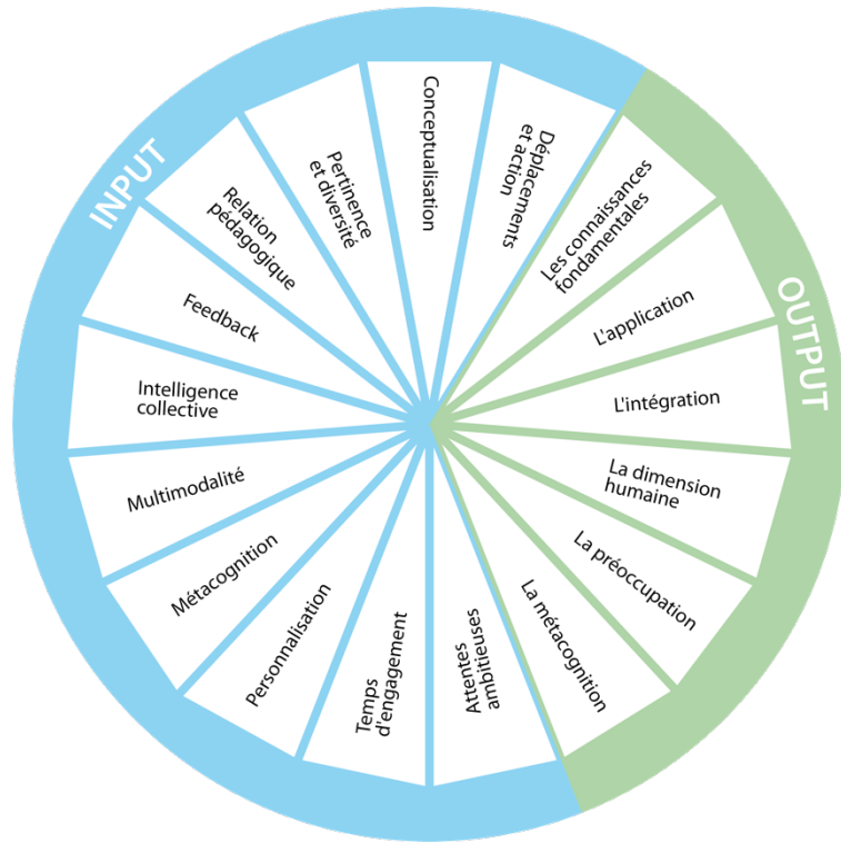
Figure 1 : critères pédagogiques des environnements capacitants