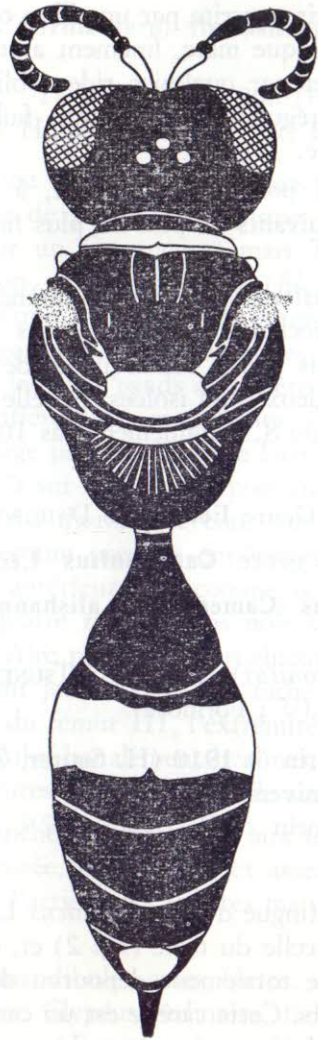
FIG. 2 : Ectemnius (Cameronitus) alisbanus TSUNEKI ♀

Il n'est pas exclu qu' alisbanus doive finalement être tenu pour une sous-espèce de menyllus (CAMERON, Himalaya).