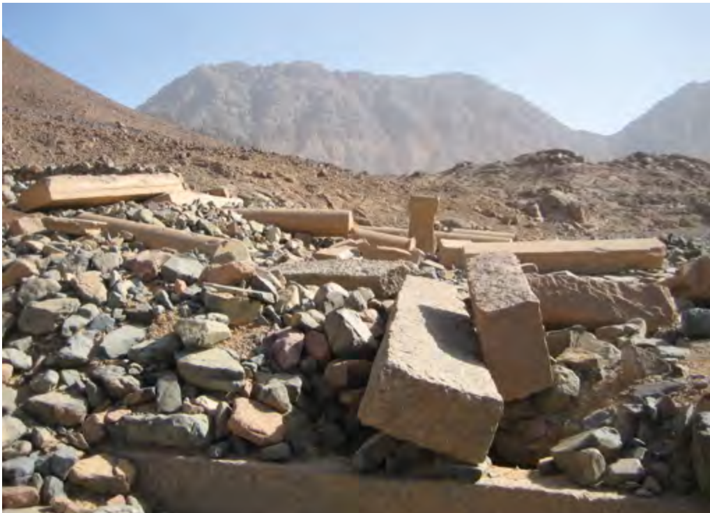
Abb. 4-5 In den römischen Steinbrüchen für Purpurroten Porphyr des Mons Porphyrites / Ost-Wüste (oben im Hintergrund: Rampe für die von den Gipfeln geholten Steine; unten: Ruine des Serapis-Tempels).

Gefäße. Es ist in der ägyptischen Ostwüste zu finden und wurde fast ausschließlich in vor- und frühdynastischer Zeit (ca. 4. Jt. – 2650 v. Chr.) zur Gefäßproduktion genutzt.