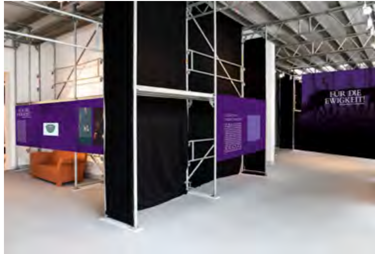
Abb. 6 Erster Entwurf für den Eingangsbereich der Ausstellung „Für die Ewigkeit! Altägyptische Steingefäße“ (nicht realisiert).