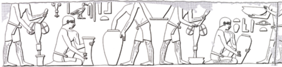
Abb. 1 Darstellung der Gefäßherstellung mit Handkurbelbohrern aus einem Grab des Alten Reiches (um 2400 v. Chr.). Foto von Emily Teeter (Chicago) / Zeichnung von Peter der Manuelian (Boston).

Dann verbreiterte man dieses mit einem Steinbohrer, als dessen Bohrkopf unterschiedlich geformten Hornsteinknollen dienten. Bei genauerer Betrachtung können Spuren dieser Tätigkeit an vielen Gefäßen noch heute mit dem bloßen Auge ausgemacht werden. Gefäßmündung und Henkel wurden unter Einsatz von Feuersteinklingen zurecht-„geschnitten“. Der Feinschliff erfolgte schließlich wohl mit handgroßen Kieselsteinen aus silifiziertem Sandstein, der wie Schmirgelpapier die Oberfläche des Gefäßes polierte. Die hohe Stellung der in diesem Bereich beschäftigten Handwerker bezeugt die Tatsache, dass das altägyptische Wort für „Handwerker / Künstler“ (ägyptisch: Hmw / Hemu ) mit der Hieroglyphe in Form dieses Steinbohrers geschrieben wurde.