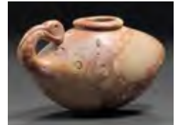
Abb. 1 Steingefäß in Gestalt eines Ibis (Berlin, Ägyptisches Museum, Inv.-Nr. 24100).

Bereicherten zu Anfang zumeist 1–2 Steingefäße das Grabinventar, übersteigt die Anzahl der in die Königsgräber der 1. Dynastie beigegebenen Steingefäße leicht die Tausend-Stück-Marke. Glaubt man den Hochrechnungen zu den Steingefäßen aus den unterirdischen Galerien der Djoser-Pyramide, so hatte der König zu Beginn der 3. Dynastie sogar ein Set bestehend aus ca. 20.000 Steingefäßen erhalten. Bei der Fertigung dürfen wir daher getrost bereits von einer wahrlichen Massenproduktion ausgehen, die nur von der Nahrungswirtschaft abgekoppelt, in spezialisierten Werkstätten denkbar ist. Wenngleich bislang kaum Siedlungsreste aus der Zeit vorliegen, die uns einen besseren Einblick in die Organisation und die einzelnen Herstellungsprozesse solcher Werkstätten erlauben, so ist die Verbindung mit Zentralorten wie etwa dem alten Memphis oder Abydos, Hierakonpolis etc. vorstellbar. Die Perfektion der frühen Stein-