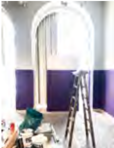
Abb. 5 Nach den Malerarbeiten.