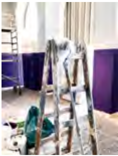
Abb. 4 Zwischenstand der Ausstellung.