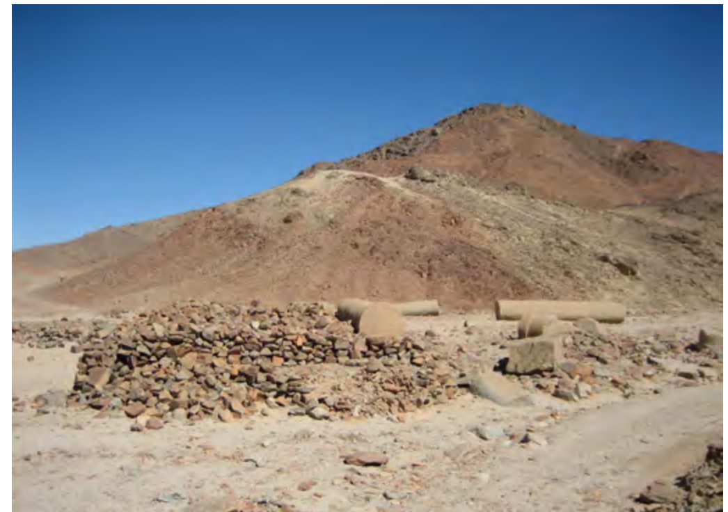
Abb. 2-3 In den römerzeitlichen Granodiorit-Steinbrüchen des Mons Claudianus / Ost-Wüste (unten: Verladerampe der für Rom bestimmten Säulen).