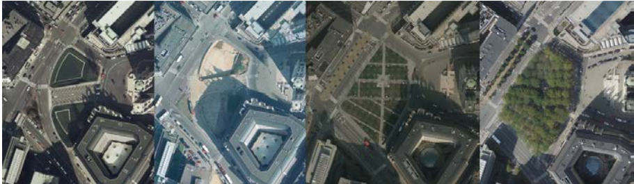
Fig. 6. Évolution de la situation du parvis de 1970 à 2010, d'après : https://bruciel.brussels/ .

Techniquement, le projet impose le comblement des deux îlots correspondant au passage de la jonction pour obtenir un espace continu en pente depuis le boulevard vers la Cathédrale. La SNCB exige que le toit de la jonction reste accessible pour gérer son étanchéité, et que la charge soit la plus faible possible. Une deuxième dalle de béton est donc construite pour permettre l'accès au toit de la jonction, et le substrat utilisé pour remplir les deux trous est composé à 50 % de billes d'argex (argile soufflé) et 50 % de terre végétale. La réalisation des