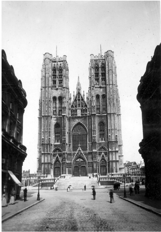
Fig. 1. La collégiale Saints-Michel-et-Gudule vue depuis la rue Sainte-Gudule, 1905 (© Bruxelles, KIK-IRPA, A100662).

aménagée au XVIII e siècle. Les îlots bâtis qui cadraient jusque-là les vues sur l'église et mettaient en évidence son échelle monumentale sont sacrifiés à la construction du large boulevard qui couvre les six voies ferroviaires parallèles. La façade ouest de la collégiale est dès lors exposée à la vue depuis une perspective plus large et lointaine, et progressivement environnée d'immeubles modernistes qui s'élèvent le long du boulevard. Un parvis élargi est aménagé, composé de zones gazonnées traversées par une voie axiale bordée de places de parking (fig. 2). Au sud-ouest de cet espace, en contrebas de la gare centrale, une vaste zone triangulaire reste en friche. Bordée par les fronts bâtis subsistants des rues de la Montagne et de la Madeleine, formant des ensembles pittoresques de maisons traditionnelles à pignons, elle est provisoirement aménagée en