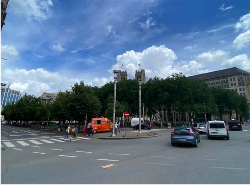
Fig. 7. Le parvis vu de l'angle de la rue de la Montagne et du boulevard de l'Impératrice en juillet 2024