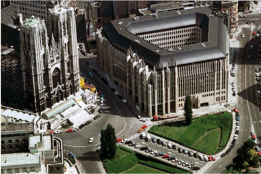
Fig. 4. Situation du site avec le bâtiment « Marquis » de l'Atelier de Genval.

Le parvis de la Cathédrale est alors encore organisé en deux îlots engazonnés en dépression séparés par une rampe d'accès utilisée comme parking. Le parvis est bordé d'un nouvel immeuble administratif, « le Marquis », doté d'appendices rappelant l'architecture gothique pour s'intégrer au paysage de la Cathédrale (fig. 4) 24 .