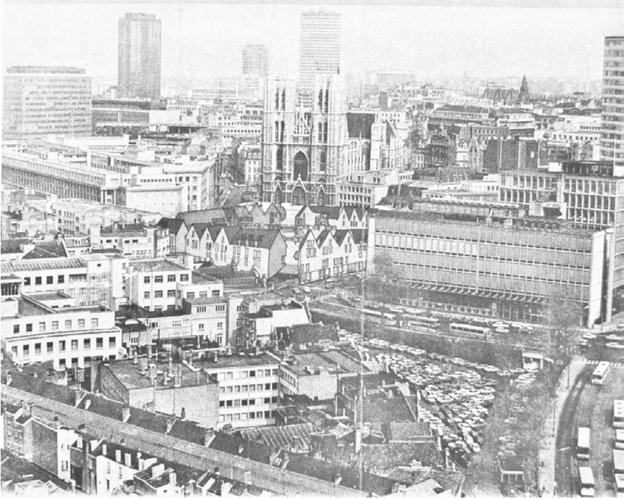
Fig. 3. Raymond Lemaire et André Stevens, projet pour le parvis de la cathédrale, vue depuis la flèche de l'hôtel de ville, montage photo, nd.

effet de diversité pittoresque faisant écho à l'alignement des maisons de la rue de la Montagne, mais contrastant avec l'environnement moderniste de l'église.