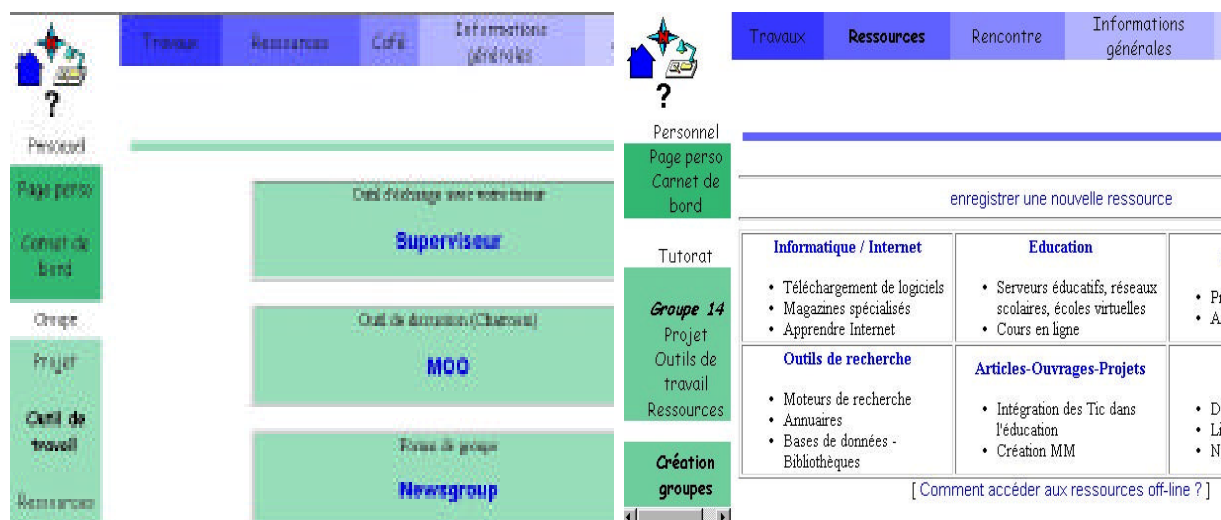
Figure 1 : L'espace de travail étudiants (outils de travail)

Nous voudrions ici nous centrer sur le design pédagogique du campus virtuel. Selon Peraya, Piguot et Joye [8], un campus virtuel est « un espace de travail virtuel, intégrant de multiples outils gérés dynamiquement, organisé conceptuellement et structurellement à partir de la métaphore du campus ». L'organisation de l'espace du campus LEARN-NETT présente deux dimensions différentes. La première concerne la distinction entre trois espaces destinés à des publics différents : public, étudiant et organisateur. Ces trois espaces se présentent sous la forme d'un bureau virtuel et constituent les mondes autonomes du campus. La deuxième dimension est celle de l'interface qui est identique pour tous les utilisateurs, mais dont les outils disponibles se différencient selon les espaces (Figures 1 et 2).