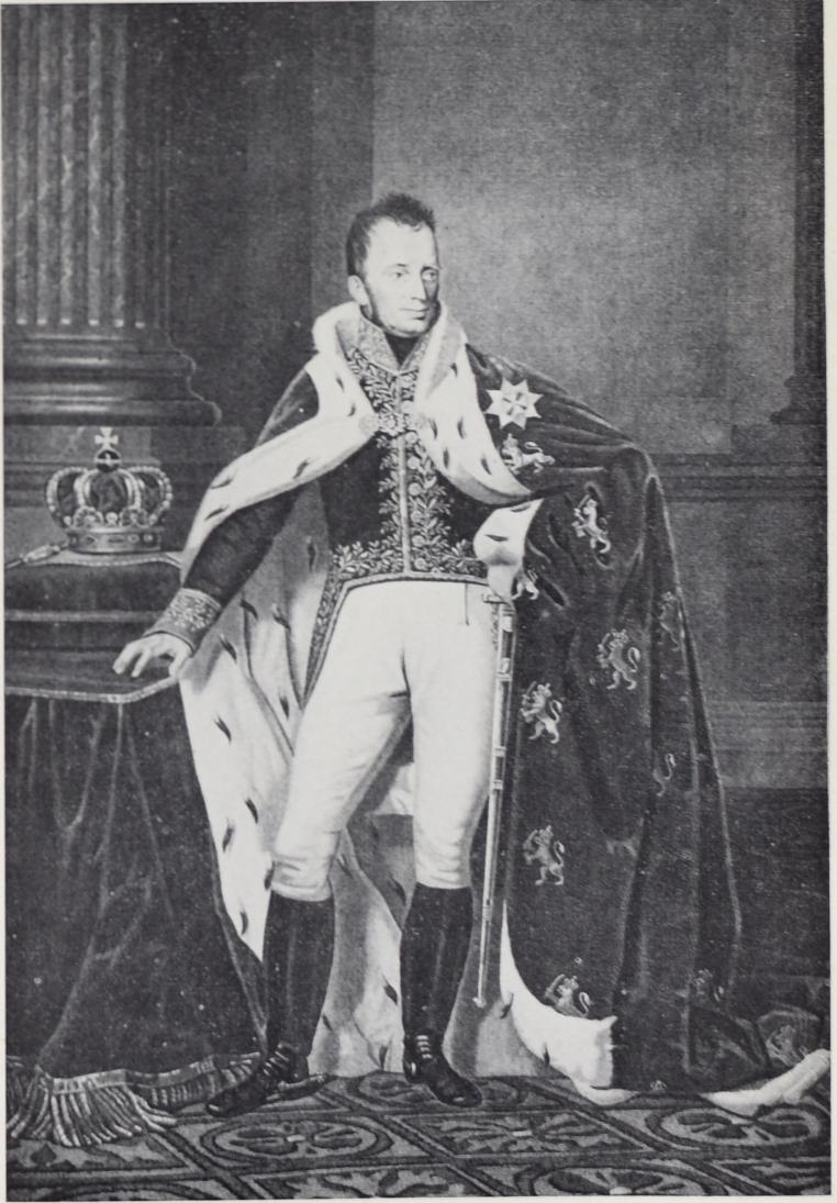
Koning Willem I.