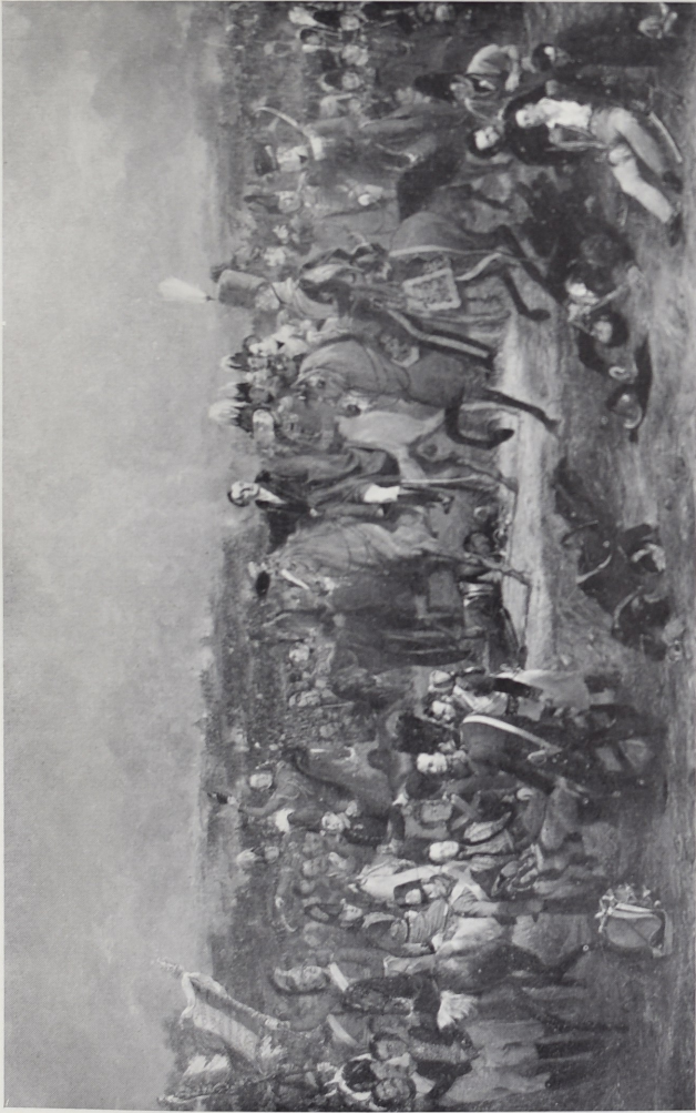
Na de slag bij Waterloo.