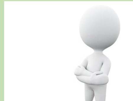
Directeur de thèse