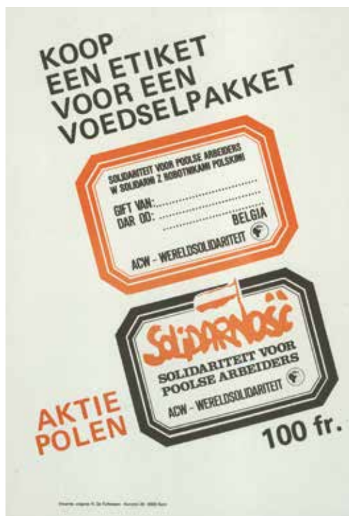
Affiche van ACW-Wereldsolidariteit met een oproep tot steun aan de Poolse vakbond Solidarność, begin jaren 1980.

Bij de meeste Belgische solidariteitsbewegingen met Iran merken we echter geen verzet tegen de Sovjet-Unie. Die stelde zich immers vrij neutraal op tegenover de Iraanse Revolutie, om haar economische betrekkingen met de sjah en haar ideologische invloed op een deel van de bevolking niet in het gedrang te brengen. 16 Alleen de maoïsten van de Association des étudiants iraniens en Belgique verweten de USSR passiviteit, ook al waren ze milder dan tegenover de VS. 17