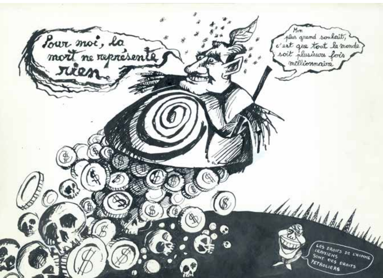
Spotprent met de sjah als Alfred Jarry's Père Ubu, met de Amerikaanse president Jimmy Carter naast hem. (In: Petit livre noir des pensées du shah d'Iran, 1978, Institut d'histoire ouvrière, économique et sociale (IHOES), Seraing)

campus van de ULB. 8 Het Comité solidarité Iran (CSI) en het VIK, die ideologisch veel dichter bij elkaar stonden, onderhielden wel vriendschappelijke betrekkingen en werkten zelfs af en toe samen. Verrassender was dat de maoïsten op een gegeven moment de hand reikten aan de progressieve moslims. 9 Zij stonden dus niet volledig afwijzend tegenover de samenwerking met een deel van de islamitische oppositie.