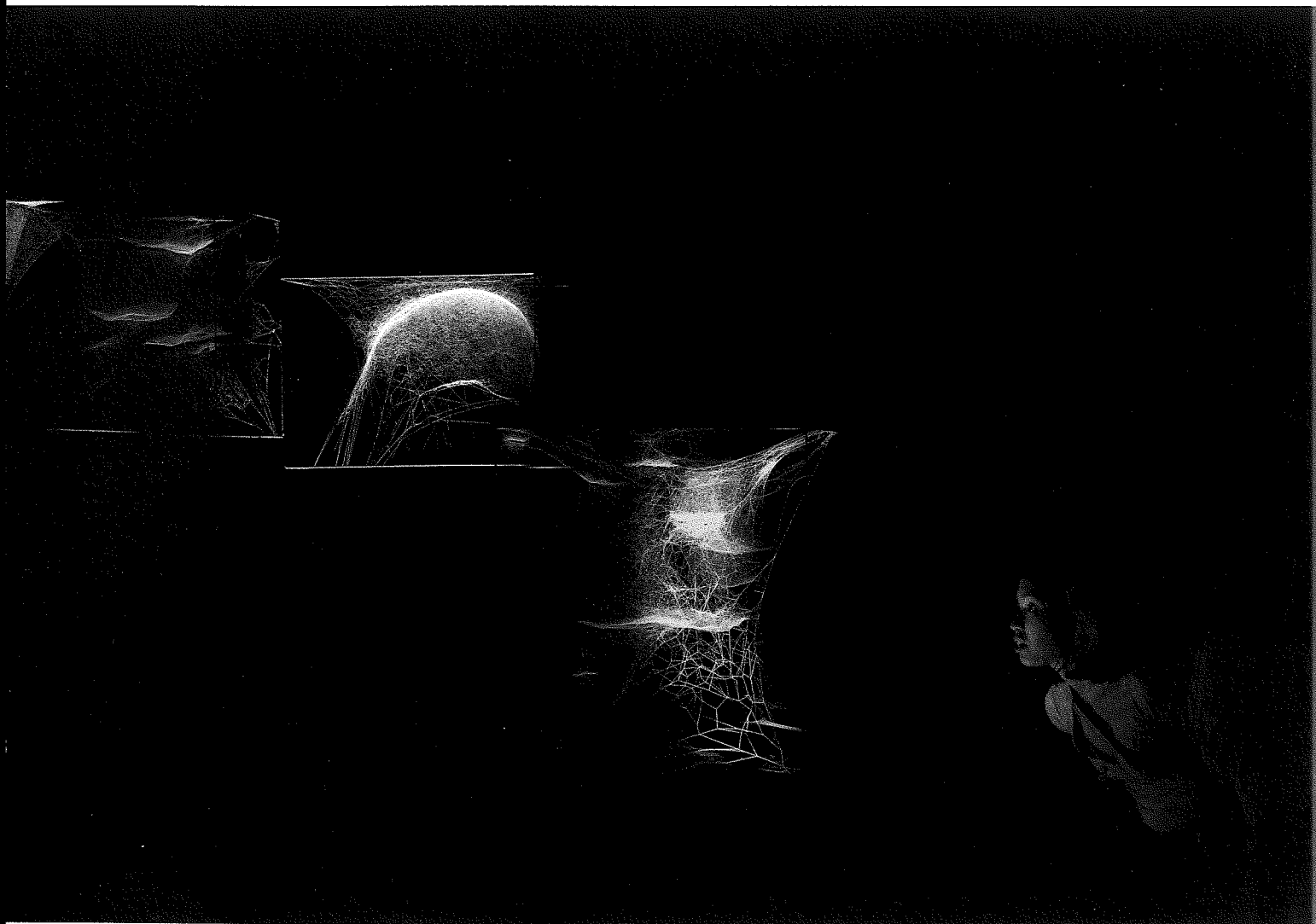
Fig. 1. Tomás Saraceno, Webs of At-tent(s)ion , 2018. Installation view at ON AIR , carte blanche exhibition to Tomás Saraceno, Palais de Tokyo, Paris, 2018. Curated by Rebecca Lamarche-Vadel. Courtesy of the artist and Esther Schipper, Berlin. © Photography by Studio Tomás Saraceno, 2018.