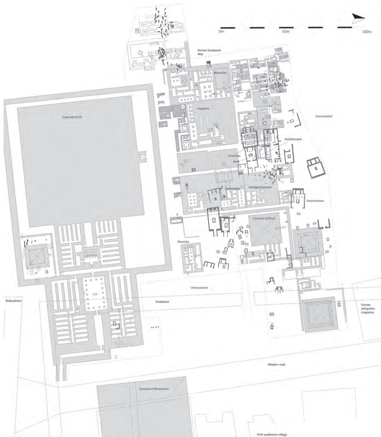
Fig. 2 The Teti Pyramid Cemetery in the New Kingdom, projected on the Old Kingdom mastaba field (preliminary reconstruction). Map by the author.

The forecourt (not part of the initial tomb design but added later) and second courtyard contain a total of four shafts that were used to bury dozens of individuals (Raven, Verschoor, Van Walsem and Vugts, 153–161). It shows