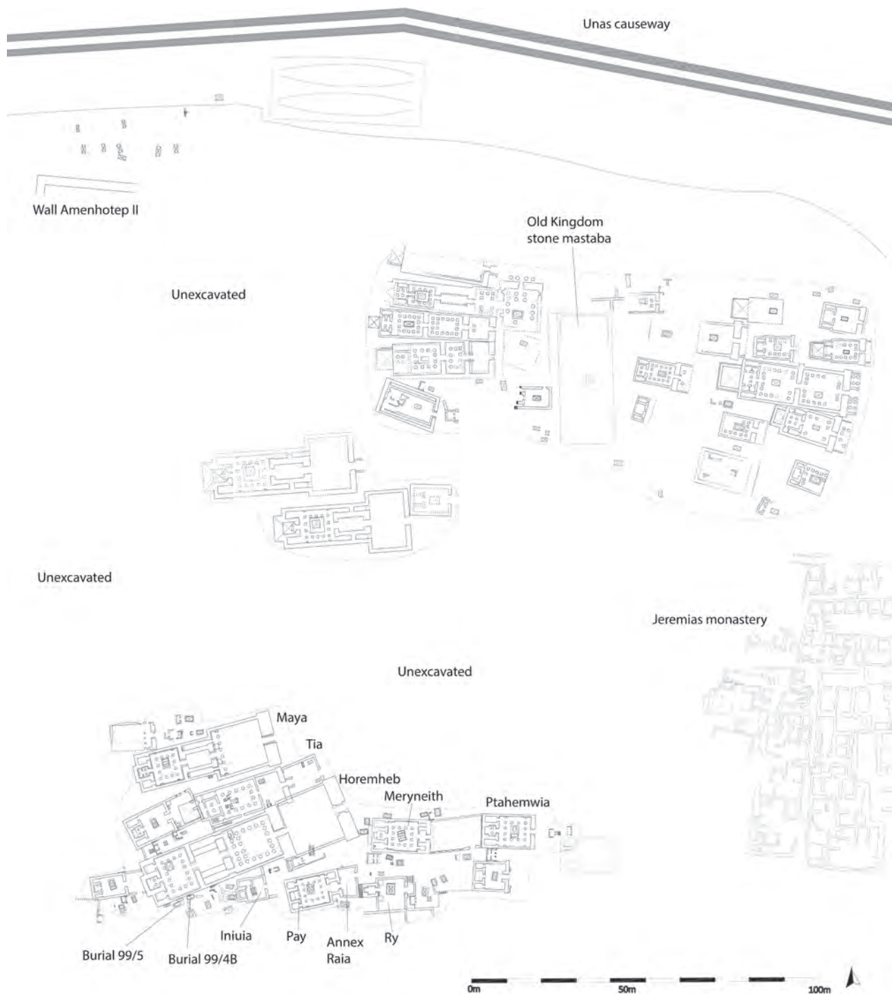
Fig. 1 The Unas South Cemetery in the New Kingdom (preliminary reconstruction). Map by the author.

The reign of Amenhotep III witnessed a development towards monumentalising tomb architecture. The evidence mainly revolves around the inscribed and decorated stone elements deriving from the tomb of the Chief Steward of Memphis, Amenhotep Huy. The tomb was excavated in the 1820s, and although its exact location has subsequently been