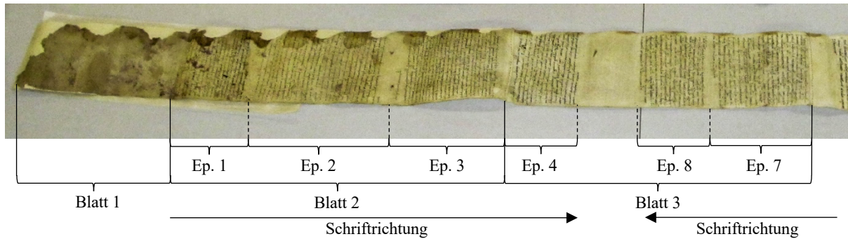
Abb. 2: Die Rückseite des Rotulus von Ravenna (Blätter 1–3; Briefe 1–4, 7–8).