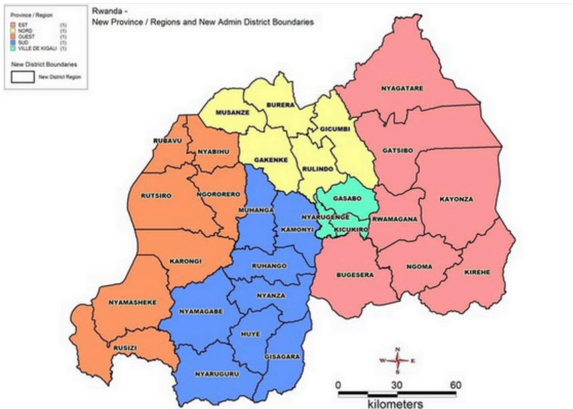
Figure 2. Localisation de la Région agricole des sols de laves sur la carte du Rwanda (Districts de Rubavu, Nyabihu, Musanze et Burera)