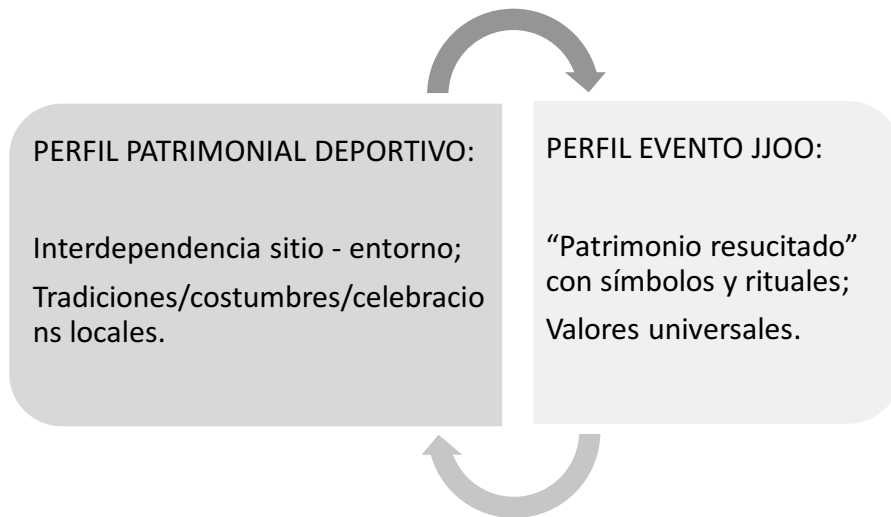
Imagen 1. Esquema: El patrimonio del estadio olímpico, un patrimonio específico (Kiuri, 2021).