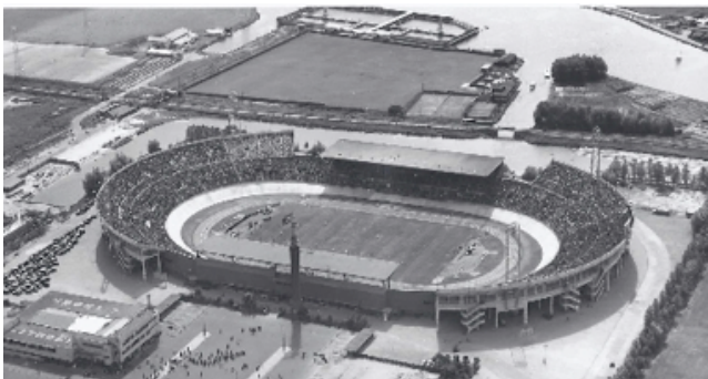
Imagen 3. Estadio olímpico Múnich'72, Patrimonio local (PM en curso) (Kiuri, 2019).