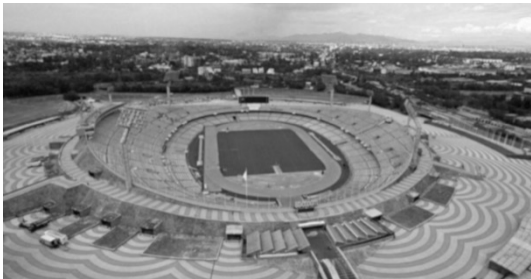
Imagen 6: Estadio Olímpico Universitario en el 1968.