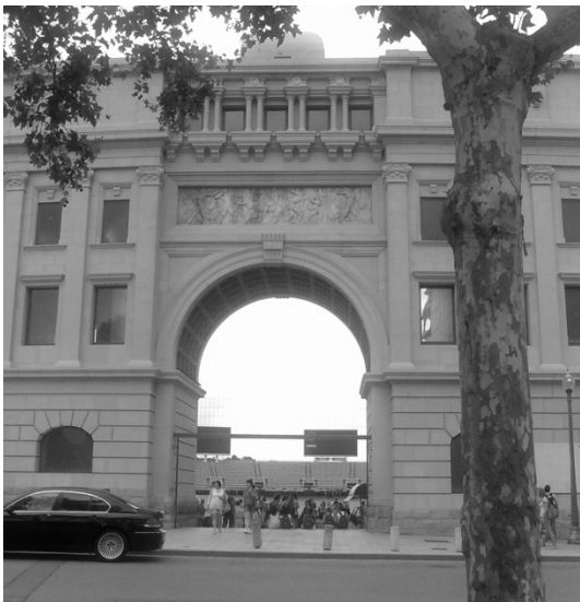
Imagen 2 : Entradas arcadas en la fachada histórica, diálogo entre espacios.

De los 20 estadios olímpicos modernos del siglo XX, 5 estadios han sido demolidos (una demolición programada), 8 estadios han sido transformados y/o renovados y 7 estadios (como edificio, conjunto o paisaje) están catalogados como patrimonio (Tabla I). Algunos de estos estadios patrimonio han tenido transformaciones a lo largo de los años (Kiuri y Teller, 2012). El estadio de los Juegos de la IV Olimpiada de Londres 1908, The Wite city stadium , el primer estadio de espacio ovalado cerrado y multideportivo, ya no existe. El estadio olímpico de Amberes 1920 de los primeros JJOO después de la Primera Guerra mundial ha sido demolido en 2001. Fue el estadio más polivalente en la historia de los estadios olímpicos. El estadio olímpico de Barcelona'92, construido en 1929, se reformó para los JJOO (cancha y gradas), preservando su fachada histórica (Imagen 2).