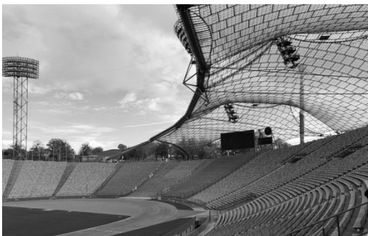
Imagen 7: Estadio olímpico de Munich 72 (Kiuri, 2019).

El estadio de Olimpia, el de México'68 y el de Munich'72 son tres estadios olímpicos con tres maneras de dialogar con el entorno ((Imágenes 5; 6 y 7): el primero por su composición visual representa un síntesis entre cultura y naturaleza; el segundo, un símbolo del binomio arte-deporte, tiene una configuración de plasticidad excepcional cuyas tribunas (gradas) permiten que el espacio del estadio se enriquezca de su entorno