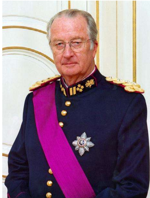
Albert II 1993-2013