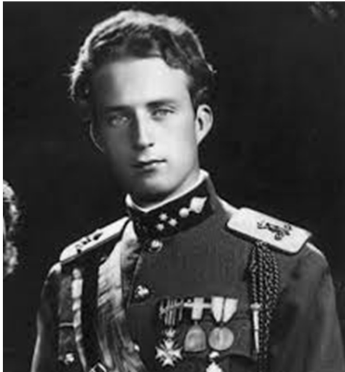
Léopold III 1934-1951