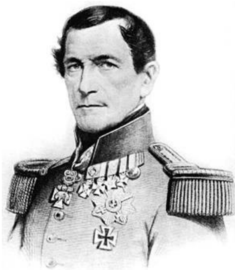
Léopold (I er ) 1831-1865