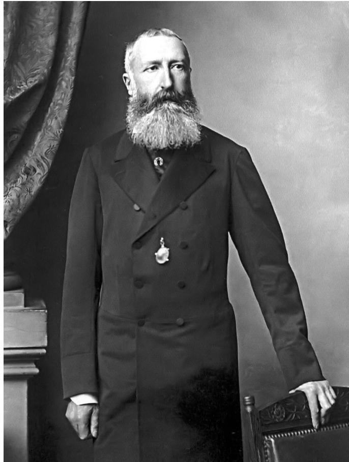
Léopold II 1865-1909