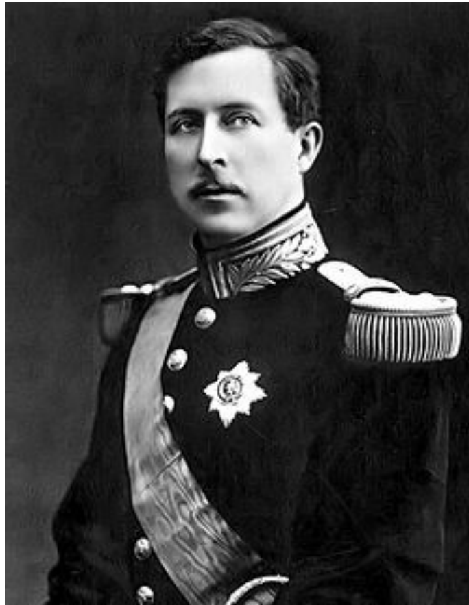
Albert (I er ) 1909-1934