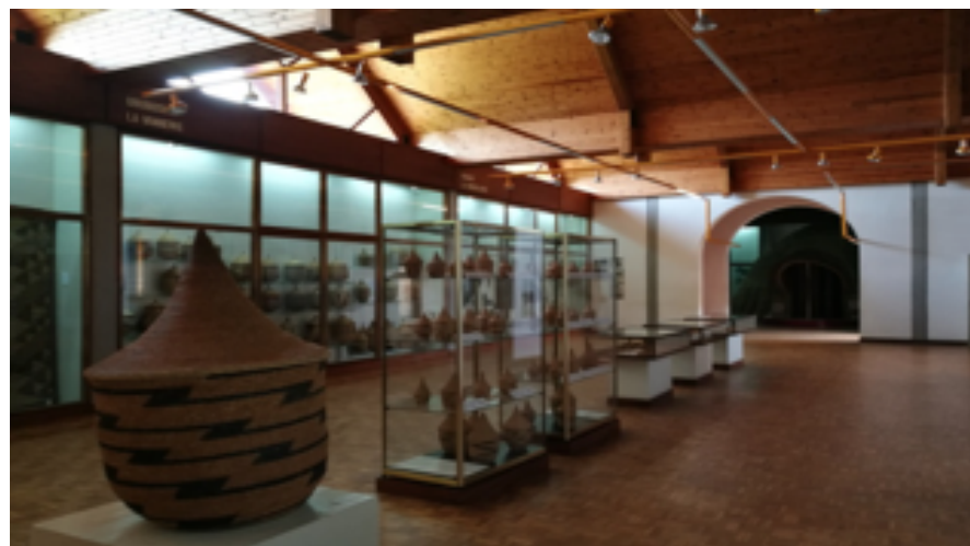
Un modèle occidental de musée au Burundi et au Rwanda