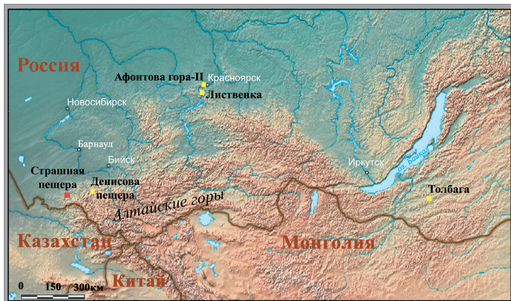
Рис. 1. Пещера Страшная на карте Южной Сибири и Забайкалья. На карте обозначены памятники верхнего палеолита, на которых были найдены костяные иглы с ушком

высотой около 6 м. По строению пещера простая горизонтальная, протяженностью около 20 м. С юго-запада к пещере примыкает терраса высотой 18–25 м от уреза реки, отделенная от пещеры скальным уступом. Специфическое расположение пещеры позволяет рассматривать ее как достаточно надежное временное убежище в древности.