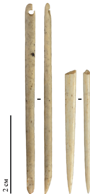
Рис. 2. Костяные иглы пещеры Страшной: 1 – игла с ушком из слоя 3 3 ; 2 – дистальный фрагмент иглы из слоя 3 1 а

В проксимальной части иглы №1 на просверленном отверстии также фиксируются очевидные следы утилизации. Контур отверстия был деформирован продолжительным износом и сформирован под углом к продольной оси изделия (рис. 3). Также активное использование иглы привело к ослаблению одного из краев отверстия и последующему слою. Таким образом, после слома в дистальной части игла №1 продолжала использоваться, но была отбракована из-за вызванного износом слома ушка в проксимальной части.