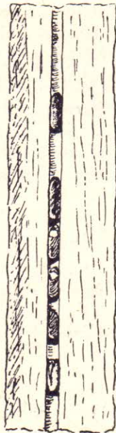
Fig. 2. — Nidification d' Osmia parvula D. et P. parasitée par Stelis ornatula KLUG. Seule la cellule inférieure n'a pas été parasitée. (Croquis effectué après la sortie des adultes).

13. — Anthidium manicatum F. — Tous les étés de 1936, 1937, 1938 et 1939 se sont passés sans nous permettre de trouver une seule Anthidie, à Beyne. Depuis 1940, de nombreux exemplaires viennent butiner dans notre jardin, attirés sans doute par le grand nombre des plantes mellifères (surtout Labiées) qui y ont été introduites. Ils apparaissent dès le début de juillet pour butiner surtout Stachys (Betonica) officinalis TREV., Nepeta cataria L. et Anchusa officinalis L., ensuite Marrubium vulgare L. et Linaria cymbalaria L., puis, mais exceptionnellement, Antirrhinum orontium L., Verbascum thapsus L., Saponaria cathartica L. et peut-être Digitalis purpurea L.