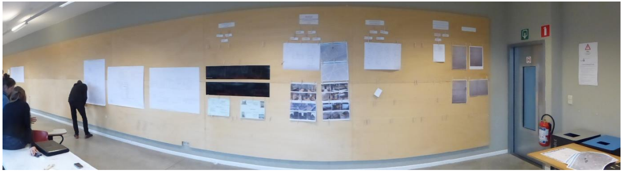
Tableau de bord mis en place par les étudiants (2018-2019) sur panneaux multiplex, à l'aide de clous, cordes de chanvre et pince à linges.

Lors de chaque moment de synchronisation, il en va de la responsabilité de chacun et de tous de fournir à l'ensemble du groupe les éléments permettant de s'appropriier collectivement l'avancement du travail. Un tableau d'avancement peut être mis en place afin d'organiser les éléments produits par chacun. Ces documents peuvent avoir plusieurs niveaux de lecture (synthèse graphique ou écrite, texte de référence, image, matériau, maquette, vidéo...) permettant ainsi à chacun de capturer rapidement le sens tout en pouvant approfondir au besoin.