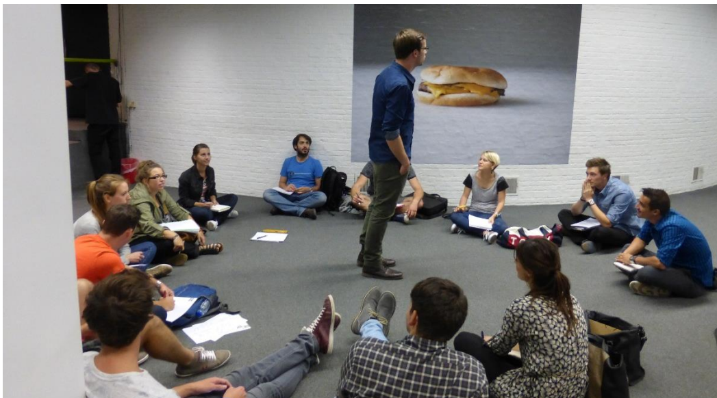
Réunion autour de la problématique de l'approche du contexte de projet