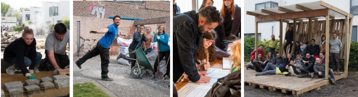
2017-2018 – Habitat-Service asbl : cour collective et espaces de travail social