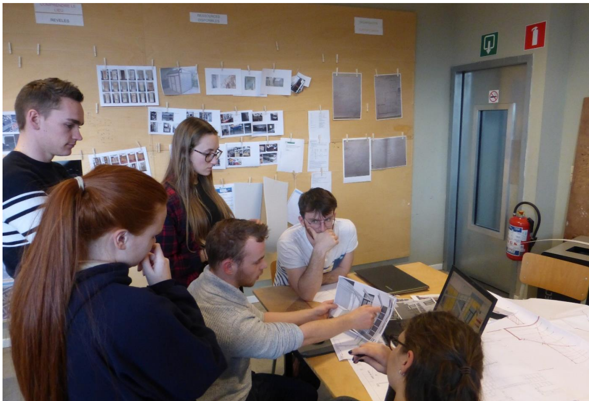
Travail en sous-groupe avec prise d'appui sur des documents issus du tableau de bord.