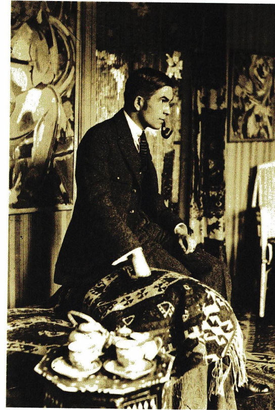
Paul van Ostaijen in het atelier van Floris Jespers in Mortsel, augustus 1918.