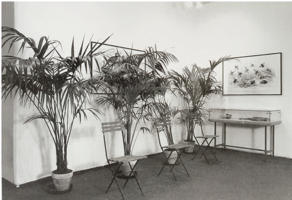
Marcel Broodthaers, L'Angélu de Daumier (Salle Verte) , 1975