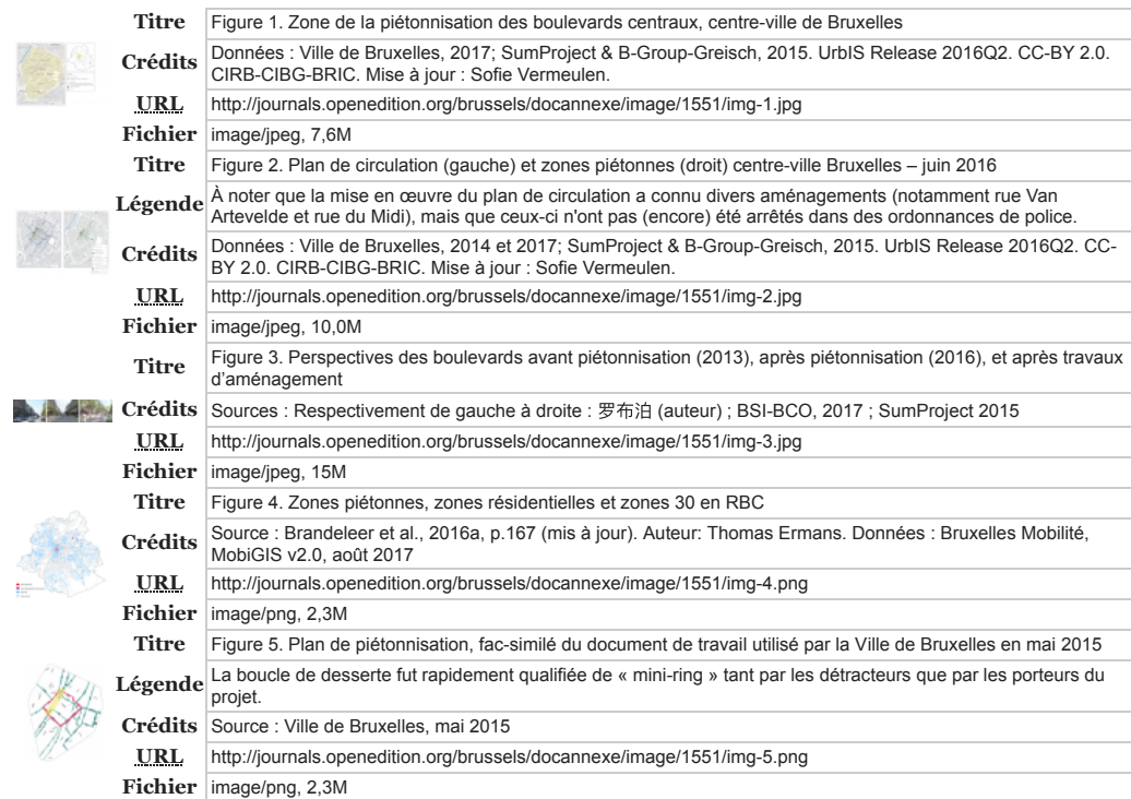
Table des illustrations