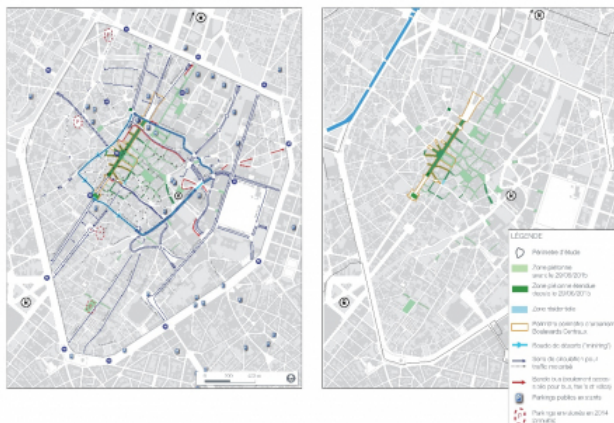
Figure 4. Plan de circulation et zones piétonnes du centre-ville de Bruxelles – juin 2016

Données : Ville de Bruxelles, 2014 et 2017; SumProject & B-Group-Greisch, 2015. UrbIS Release 2016Q2. CC-BY 2.0. CIRB-CIBG-BRIC. Mise à jour : Sofie Vermeulen.