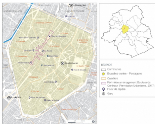
Figure 1. Zone de la piétonnisation des boulevards centraux de Bruxelles

Données : Ville de Bruxelles, 2017; SumProject & B-Group-Greisch, 2015. UrbIS Release 2016Q2. CC-BY 2.0. CIRB-CIBG-BRIC. Mise à jour : Sofie Vermeulen.