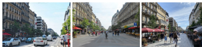
Figure 2. Perspectives des boulevards avant piétonnisation (2013), après piétonnisation (2016), et après travaux d'aménagement (2020)