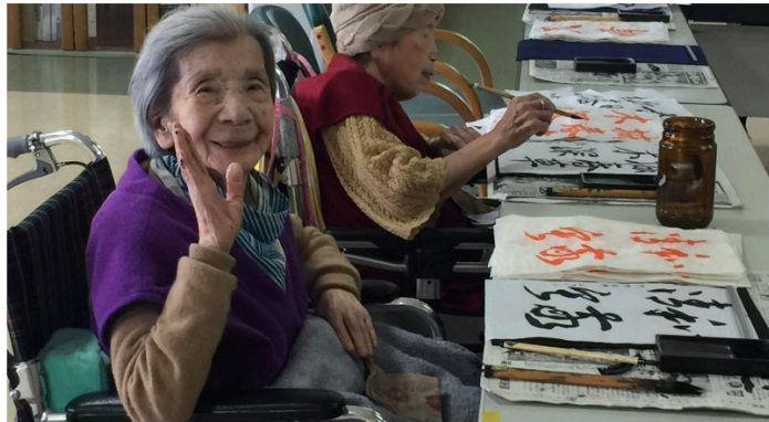
Les coopératives de santé font la différence au Japon