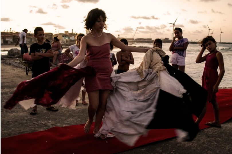
Figura 2: O Vestido, Serviluz, Fortaleza.

cena ao cenário, envolvendo as memórias dos retalhos d'O Vestido à paisagem da cidade, traçando através do seu enquadramento Maria Marítima apresenta os moradores como atores do turbilhão de emoções da experiência, compondo na sua poética, a dimensão estético-política do acontecimento.