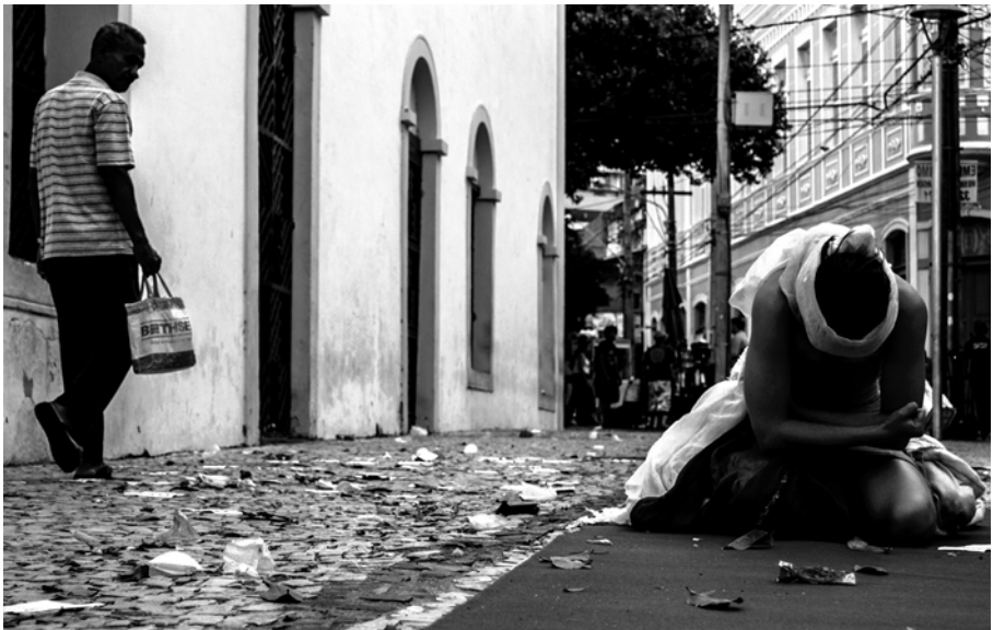
Figura 4: Centro de Fortaleza, O Vestido e a Igreja do Rosário.

pintados e colados nas paredes. O lambe é frágil, desfaz-se facilmente, pode rasgar-se ou ser rasgado, molhar-se com a chuva ou sujar com a fuligem. O tempo do lambe é imprevisível, Ceci Shiki foi ilustrando a cidade com seus personagens encantados, produzindo vínculos entre os lugares escolhidos e a passagem d'O Vestido. Sinalizava os passos da aventura pela cidade, marcava um ponto de referência, para todos poderem lembrar depois. A ilustração inventariava na cidade os gestos patrimoniais da performance. Ao selar com a cidade um novo compromisso, depois de separar-se do modo de viver o ordinário, a performance oferecia uma nova possibilidade de reapropriação, de incorporação da poética nas ruas. Os lambe-lambes referenciavam o rito de passagem, evocavam o drama social (Cavalcanti, 2013) sugerindo uma musealização urbana por meio de outras imaginações artísticas: as ilustrações da cidade.