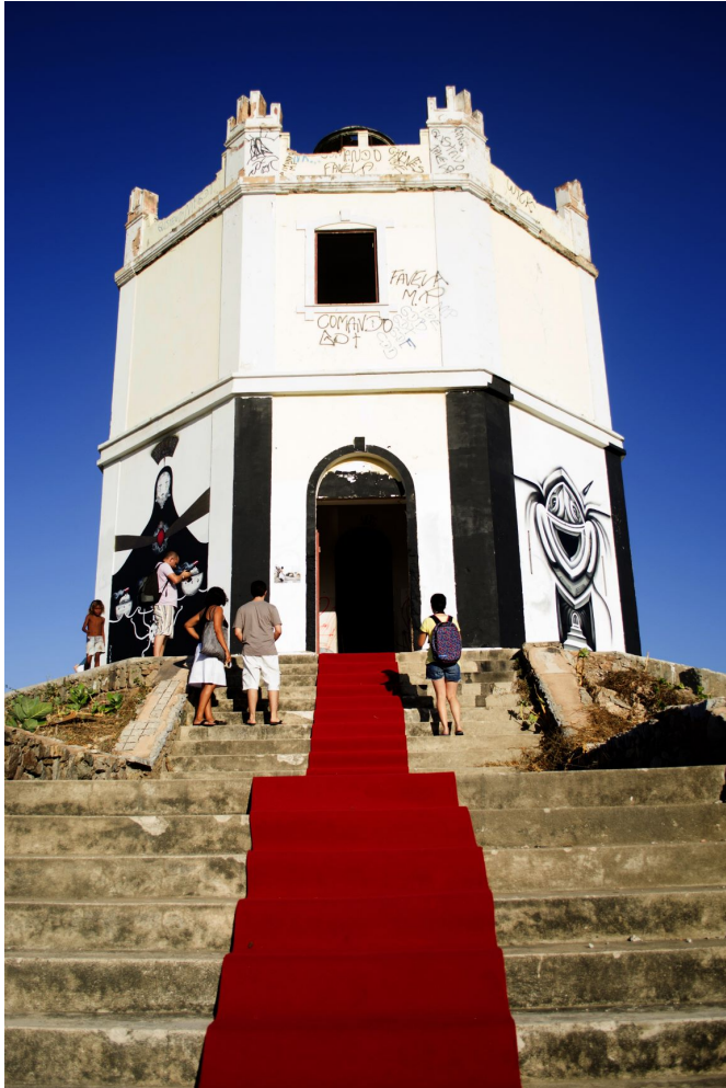
Figura 1: Serviluz, Farol do Mucuripe, Fortaleza. O Vestido.

mesmo com tantos projetos sociais e pessoas empenhadas em fazer acontecer no local. Mesmo diante dos fatos, sentimos muito amor no Serviluz (Sol Moufer, 2013)