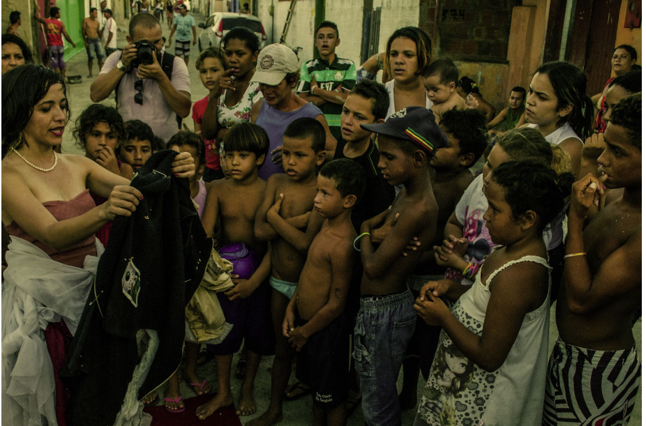
Figura 5: Serviluz, O Vestido.

Não para dizer como é o outro, nem exatamente para encerrar a narrativa em si mesmo, mas para viver o entre outros, produzir reuniões que deslocam a vida da rotina e nos permitem observá-la, adi-la de outra maneira, instaurando outros rituais para o nosso cotidiano.