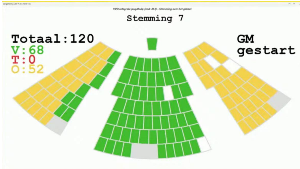
Application de vote du Parlement flamand