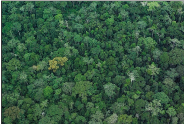
Photo 1. Forêts tropicales d'Afrique centrale.