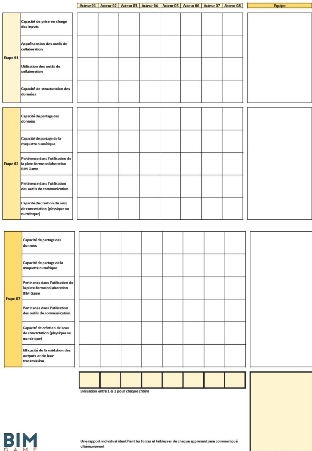
Figure 2 : Grille d'évaluation du Bim Game reprenant les différents critères d'évaluation repartis en trois types d'étape.

Chacune de ces étapes et attentes sont précisées en documentation sur la plateforme.