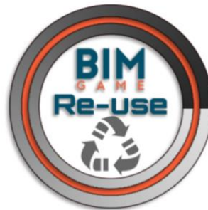
Figure 6 : Exemple de open badge : la qualité du réemploi

Les grilles d'évaluation présentées dans la première section de cet article n'étaient pas finalisées au moment de cette expérimentation. Nous n'avons donc pas d'exemples à diffuser. Par contre, pour ce scénario, sept compétences ont été relevées et un jury a récompensé les participants en distribuant des open badges mettant à l'honneur : l'originalité, le développement durable, la qualité architecturale, la qualité du réemploi, la qualité du modèle 3D, le projet favori, la présentation. La figure 6 montre un exemple de open badge.