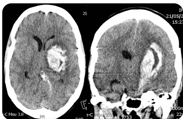
Figure 1. TDM cérébrale : hématome capsulo-lenticulaire gauche de 56x51x32 cm exerçant un effet de masse sur les cavités ventriculaires ipsilatérales avec signes d'engagement temporal et procidence des amygdales cérébelleuses.