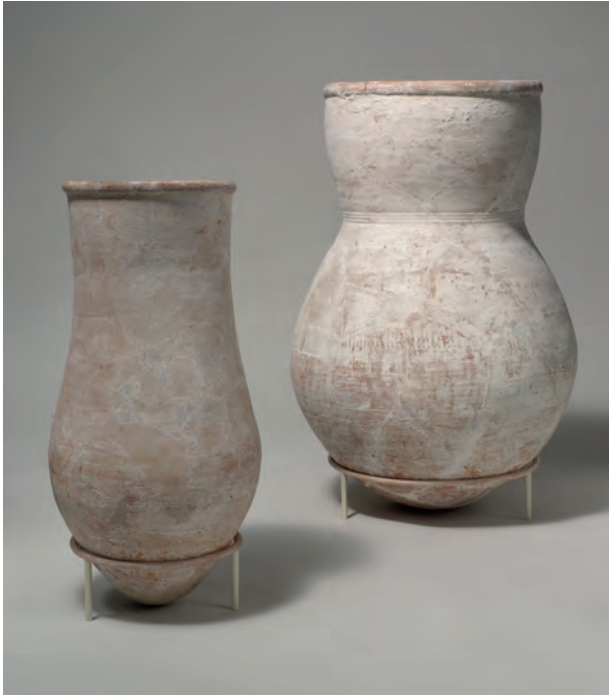
Fig. 2 : deux des six jarres provenant du puits KV 54 et conservées aujourd'hui au Metropolitan Museum of Art (09.184.8 et 09.184.1).

dans sa tombe, peu de temps avant sa fermeture. Ce matériel, jugé impropre à reposer pour l'éternité à proximité du corps de Toutankhamon, aurait été enfoui dans un puits d'une profondeur totale de deux mètres, à une centaine de mètres au sud-est de l'entrée du tombeau [fig. 3]. On déposa dans cette cache d'embaumement cent quatre-vingt-neuf poteries, retrouvées en morceaux, dix-neuf couvercles, trois bouchons de jarres en fibres, des os de canards, d'oies, d'une vache et d'un mouton ou d'une chèvre, des colliers de fleurs, des balais en fibres, trois couvre-chefs en lin, trois pièces de lin inscrites et quatre-vingt autres anépigraphes, cent quatre-vingt bandelettes dans le même matériau, vingt-quatre chutes de tissus, soixante et un paquets contenant du natron, vingt bâtonnets en roseau, en papyrus et en bois ainsi que quatre petits blocs calcaires polis 2 .