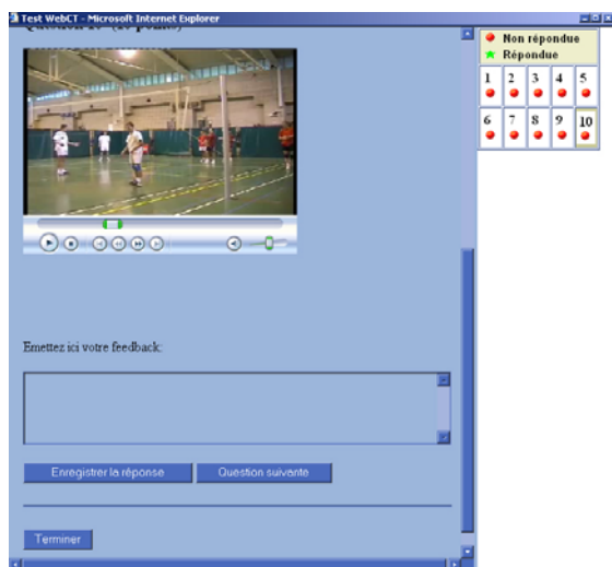
Figure 4 – L'émission de feedback

D'un point de vue strictement technique, les étudiants déclarent avoir connu peu de problèmes et avoir facilement résolu les petites difficultés qui se sont présentées. Leur satisfaction relative à la conception technique de cette partie d'activité est évidente. Interrogés sur le « plaisir » perçu lors de la réalisation de cette activité, 11 étudiants sur 16 estiment avoir passé un bon moment. Ces données nous paraissent très encourageantes lorsque l'on considère le nombre de critères concernés et la difficulté d'évaluer objectivement certains aspects des prestations. Enfin, nous sommes également rassurés sur le nombre de tests mis en ligne : une dizaine de tests nous paraissaient nécessaires même si nous craignons un caractère un peu fastidieux. Les résultats obtenus par les étudiants à ces tests, qui avaient préalablement été évalués par un collègue d'experts, sont globalement satisfaisants compte tenu de la difficulté de la tâche. Nous relevons en effet un score moyen de 69% (écart type = 5,3). Notons que l'estimation d'une éventuelle progression des utilisateurs n'est pas envisageable car les sujets pouvaient choisir de focaliser leur attention sur des critères différents pour chacune des dix séquences. Une très large majorité des étudiants (n=15) considèrent cette activité comme utile à leur formation. Leur intérêt pour cette procédure d'apprentissage renforce l'option consistant à ne pas simplifier les exigences techniques.