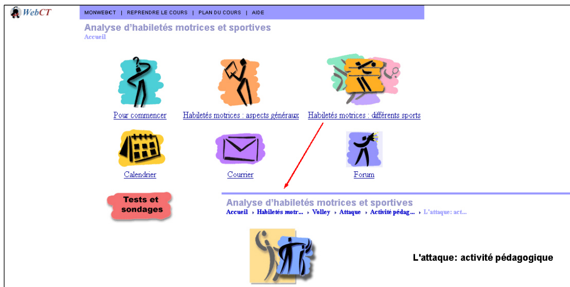
Figure 1 – Vue globale du cours d'analyse d'habiletés motrices et sportives

La première partie, intitulée « Présentation de l'attaque » propose une liste exhaustive et des illustrations des critères de réalisation d'une attaque (figure 2).