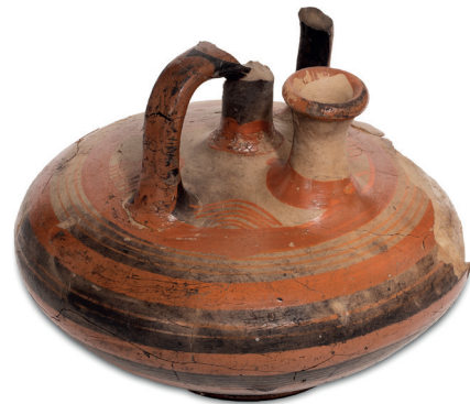
Vases à étrier mycéniens Terre cuite. Diamètres : 13 et 11,8 cm. Manchester Museum, 717 et 13893. Nouvel Empire, XVIII e dynastie. Provenance : Médinet el-Gourob.

moins temporairement, à Gourob. Le style de cette petite tête amène à penser que la reine aurait pu y résider notamment à la fin de sa vie, une période qui correspond à l'époque amarnienne et à l'enfance de Toutankhamon.