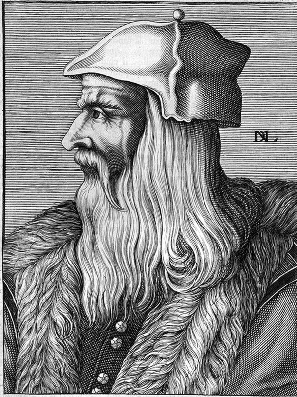
LIONARDO, DA, VINCI, PITTORE,