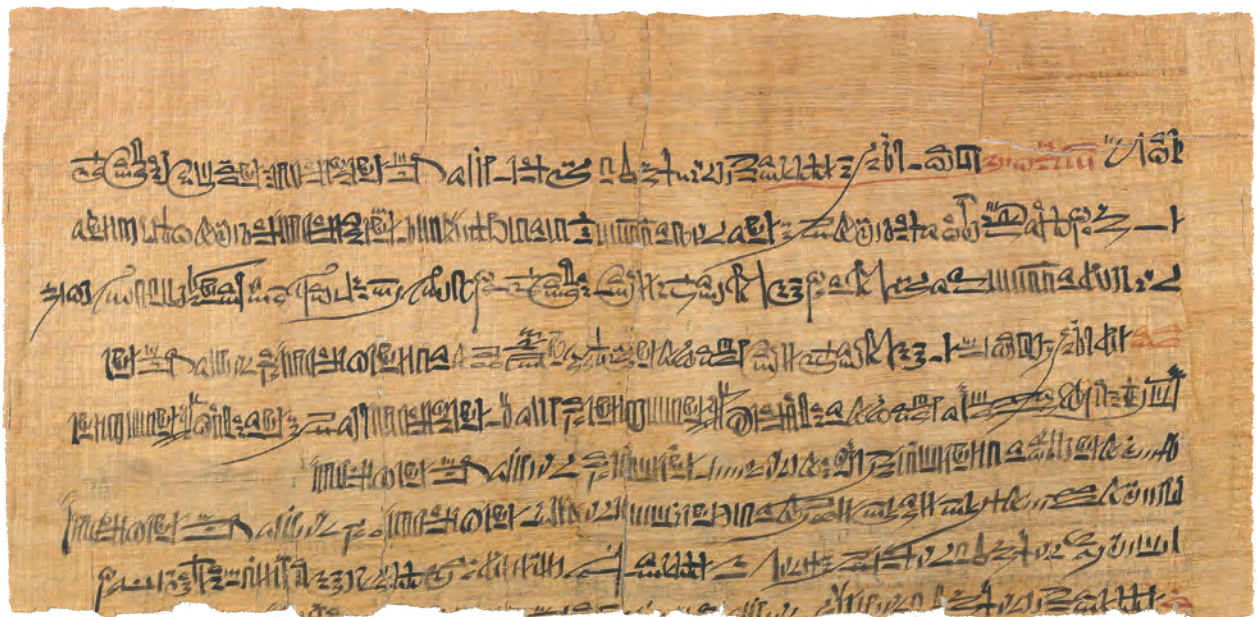
Col. 4 [H. 22,2 cm; l. 43,2 cm].

Peet, 1930; Capart & Gardiner, 1939; Raven, 1978–1979; Vernus, 1990, 11–74; Claus, 2016.