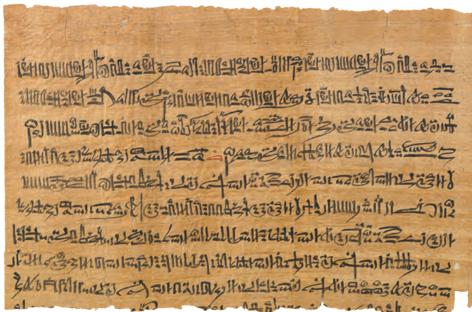
Col. 2 [H. 22,1 cm ; l. 34,8 cm].