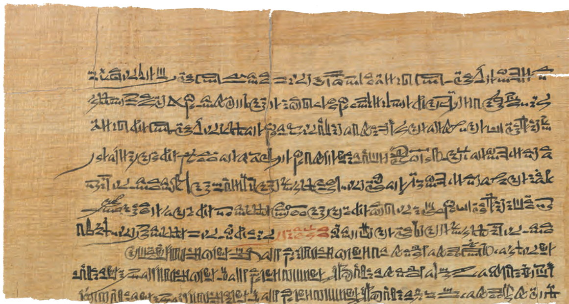
Col. 3 [H. 22,3 cm ; l. 42,6 cm].

Le texte du papyrus Léopold II-Amherst reprend essentiellement la déclaration d'un carrier du domaine d'Amon appelé Amonpanéfer, membre d'une bande ayant pillé la tombe du pharaon Sobekemsaf II, ainsi que les inculpations