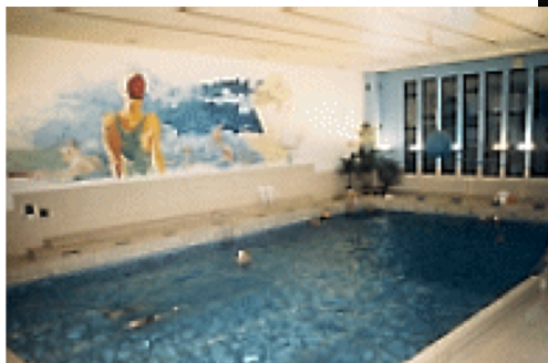
Fresque actuelle piscine de Salzinne (Alain Ranzy)