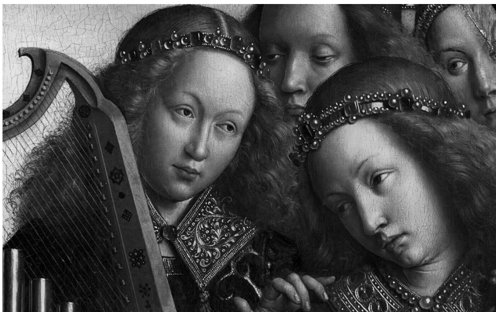
L'ADORATION DE L'AGNEAU MYSTIQUE. Détail. Van Eyck.