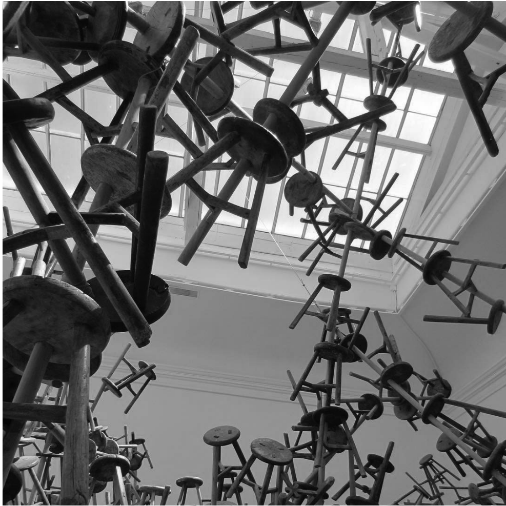
BANG. Ai Weiwei, Biennale de l'art de Venise, 2013. Image: ©AiWeiWei.