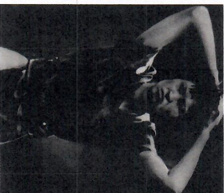
Fig. 2 - Meinhof , Johannes Kahrs, 2001.

Image 2 (Fig. 2). En 2001, l'artiste allemand Johannes Kahrs réalise un portrait au fusain et pastel. En redessinant la photo, Kahrs a accentué certaines composantes de l'image, notamment l'effilement des yeux qui deviennent bridés. Sa technique de retouche de l'image (jusqu'à la recouvrir totalement) n'est pas sans rappeler la technique des portraitistes de la première moitié du XX e siècle (retouche au pastel), qui visaient à lisser les visages et à en dégager certains traits que les artisans trouvaient primordiaux ou particulièrement avantageux.