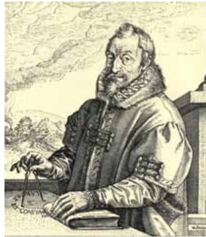
Afb. 3: Christoffel Plantijn met zijn embleem en spreuk, door H. Goltzius