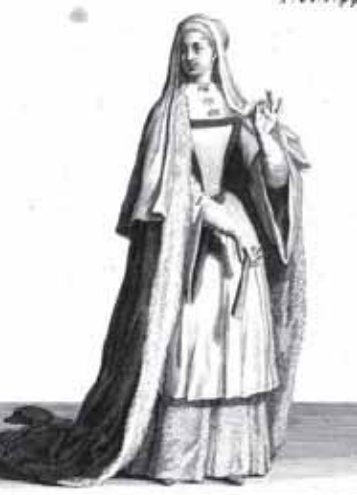
Chanoinesse de denain en habit de Choœur

Afb. 5: Kanunnikes van Denain in koorgewaad