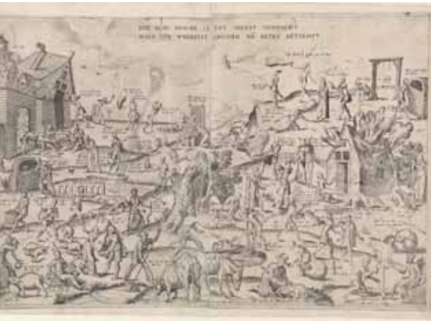
Afb. 1: Gravure De blauwe huycke van Frans Hogenberg