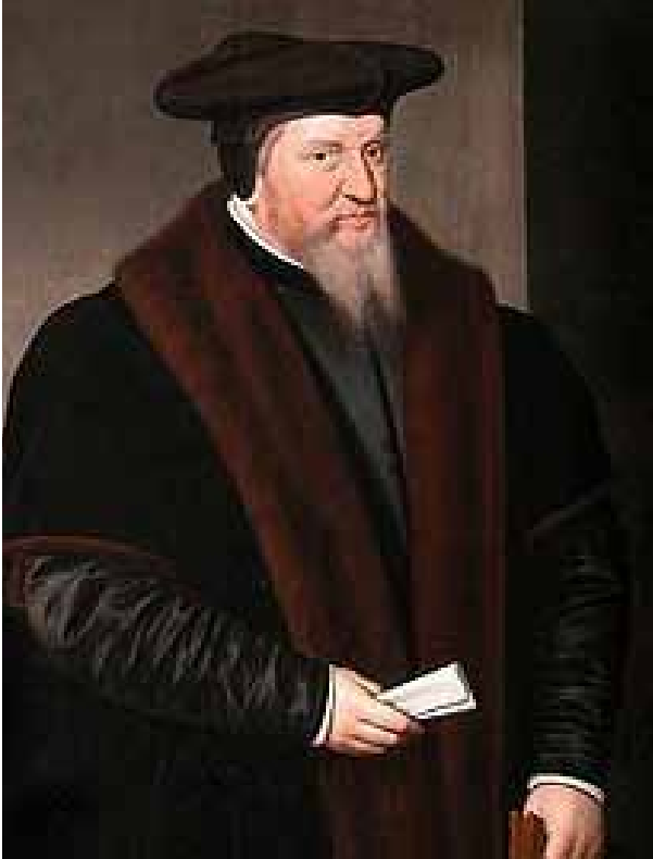
Afb. 8: Wigle van Ayta, portret door Frans Pourbus de Oudere