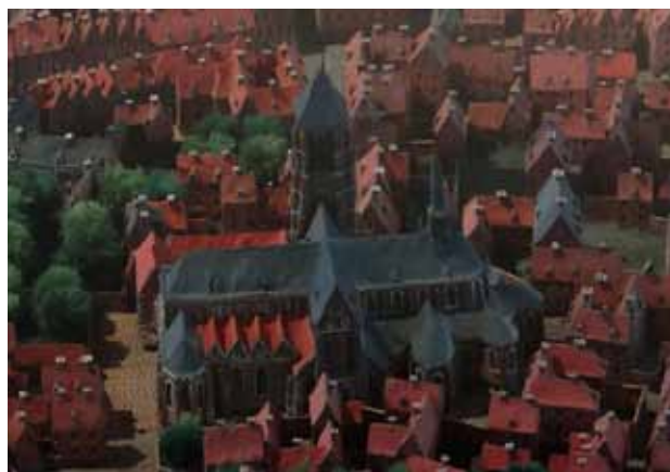
Afb. 6 : Reliëfplan (1710) van de Collégiale Saint-Amé te Douai [Douai, Musée de la Chartreuse]

Afb. 5: Kanunnikes van Denain in koorgewaad [Bron: Histoire des ordres monastiques, religieux et militaires (...), t. V, Paris, 1718]