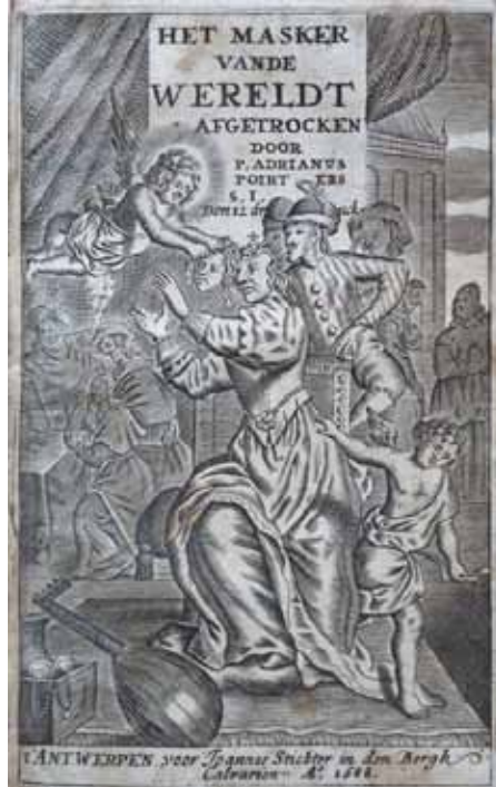
Afb. 14: Titelblad Het Masker van de wereldt afgetrocken van Poirters

Op het eerste gezicht een nogal cryptische passage, waarvan het spreekwoordelijk gehalte niet erg duidelijk is. Maar het gaat hier wel degelijk om een volkse aanduiding, namelijk van een (vaak “dringend”) huwelijk van een (in die tijd) mannelijke student met een Leuvense schone (variërend van een dienstmeid of herbergiersdochter tot een weduwe). Goedthals biedt hiervan de eerste, bij ons weten, lexicografische attestatie; hetzelfde geldt naar ons weten ook voor de corresponderende Franse uitdrukking “mariage de Louvain”.