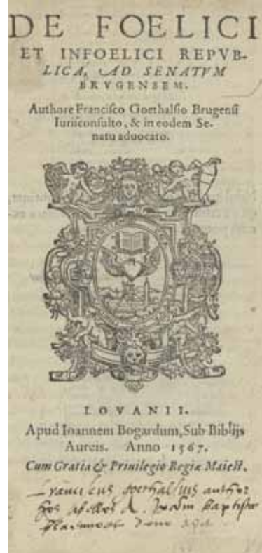
Afb. 9: Titelbladzijde van De foelici et infoelici republica [Exemplaar Bibl. RUGent]

De inhoud ervan wordt aangekondigd bij het begin in een tekstpassage gedrukt in de vorm van een storttrechter [afb. 10], en waaruit blijkt dat de auteur de specifieke kwaliteiten van “elcke tale” onderkende: