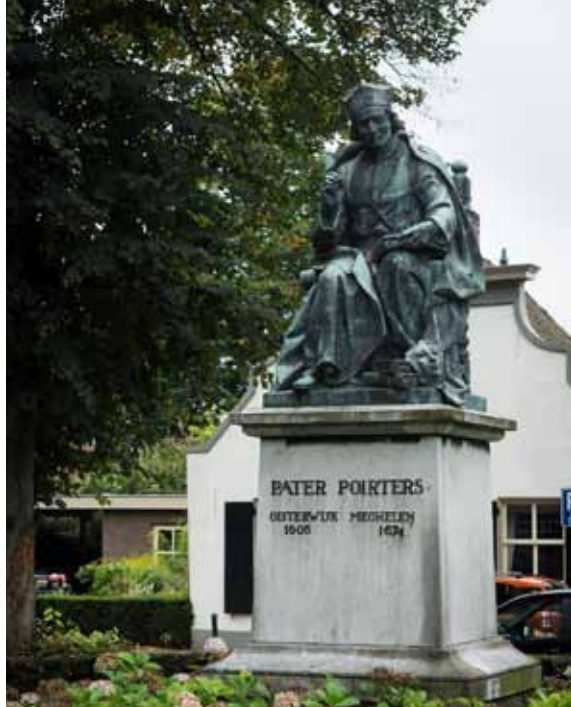
Afb. 13: Standbeeld van Adriaan Poirters te Oosterwijk