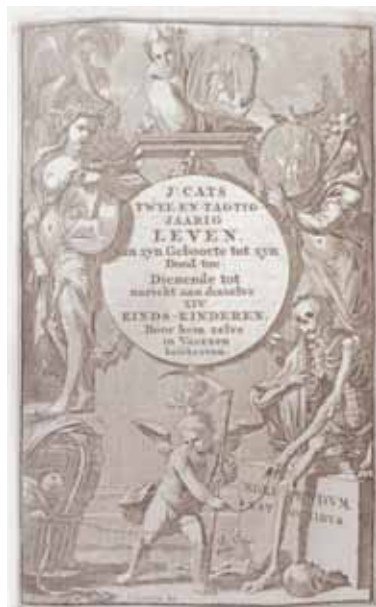
Afb. 17: Titelblad Twee-en-tagtig-jaarig leven van Jacob Cats

“Al die in haere jeught wel eer te Leuven trouwden, En op soo swacken gront haer echte leven bouwden, Die hebben in 't gemeen hier in heel misgetast, Haer saecken naderhant, die gingen niet te vast. 't Gevry was aengenaem, maer siet, ten langen lesten, Voor 't noodigh huysbedrijf en was'er niet ten besten. Den doeck ginck voor den boeck, dus had men niet geleert, En daerom wordt den wulp met geen en steen vereert. Het trouwen buytens tijts laet dat voor jonge zotten, Een Leuvens huwelijck en dient maer om te spotten: Gesellen, wieje sijt, betoomt uw weeligh bloet, Eer dat men is volleert en is geen trouwen goet”.