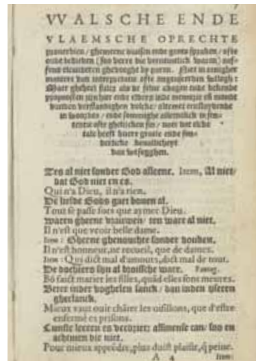
Afb. 10: Aanvang van Goethals' Proverbes

proverbien / ghemeeene divisien ende gente spraken / ofte oude bedieden (soo verre die vernemelic waren) nef-fens elcanderen ghevoeght by paren. Niet in eenigher maniere van interpretatie ofte ongeuseerden uutlegh: Maer gheheel sulcx als de selve adagen ende bekende propositen zijn hier ende elders inde memorie ende mondt vanden verstandighen volcke / altemet eenslydende in woorden / ende sommighe alleeneelick in sententie ofte ghelijcken sin / naer dat elcke tale heeft huere gracie ende sonderlicke bevallicheyt van uutsegghen.