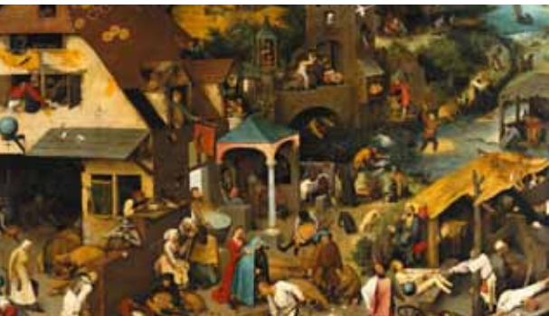
Afb. 2: Nederlandsche spreekwoorden van Pieter Brueg(h)el de Oude [Berlin, Staatliche Museen]

In het kader van een breder onderzoek naar de oudste (gedrukte) woordenboeken Nederlands (of: “Vlaemsch”) – Frans (en omgekeerd), werden verwante publicaties, zoals meertalige thematische woordenlijsten, conversatie-handboekjes en spreekwoordenverzamelingen, in kaart gebracht. Spreekwoordenverzamelingen uit de Vroegmoderne Tijd vormen een studievoorwerp dat zich leent tot complementaire soorten van onderzoek: taalkundig (nuttige informatie vanuit historisch-taalkundig perspectief en ook vanuit een lexicografische invalshoek), etnografisch (informatie over lokale en nationale folk-lore), socio-cultureel (informatie over bevolkingsgroepen, over beroepen, sociale praktijken), maar ook kunsthistorisch: men denke in dit laatste verband aan artistieke representaties van spreekwoorden, zoals men die o.a. vindt in de gravure De blauwe huycke (ca. 1556–1560, Rijksmuseum Amsterdam) [afb. 1] van cartograaf Frans Hogenberg (ca. 1535–1590) of in het beter bekende schilderij van Pieter Brueg(h)el de Oude (ca. 1525–1569), Nederlands[ch] e spreekwoorden [afb. 2] (1559, Gemäldegalerie, Staatliche Museen Berlin), waarop 125 spreekwoorden staan uitgebeeld (een kopie, van de hand van zijn zoon Pieter Brueg(h)el de Jonge [1564/5–1638], bevindt