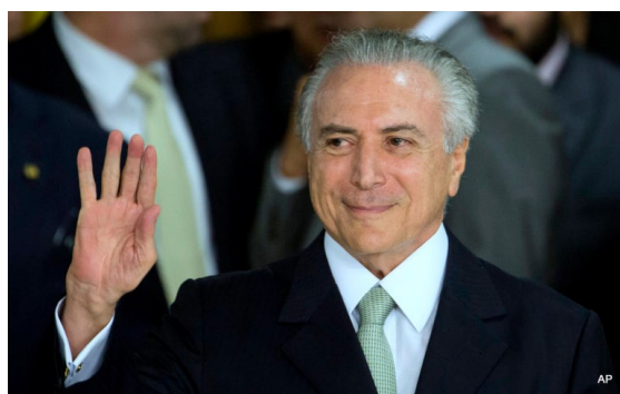
El presidente brasileño Michel Temer.

Lo cierto es que las áreas de ciencia y cultura nunca tuvieron presupuestos suficientes. Hubo alguna mejora con Lula y la gestión del exministro Gilberto Gil al frente de la repartición de Cultura.